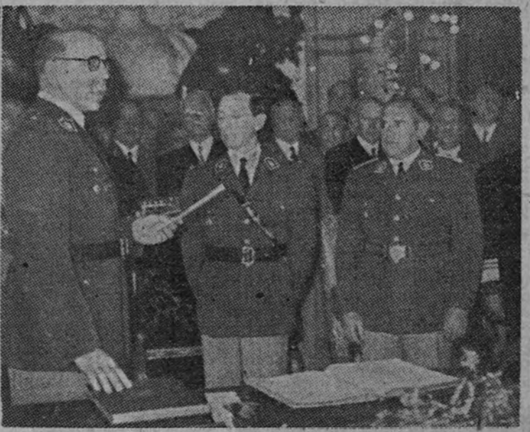
El general Farrell jura sobre los Evangelios su cargo, en presencia del Presidente Ramírez, ministros y otras personalidades, al tomar posesión de la Vicepresidencia.