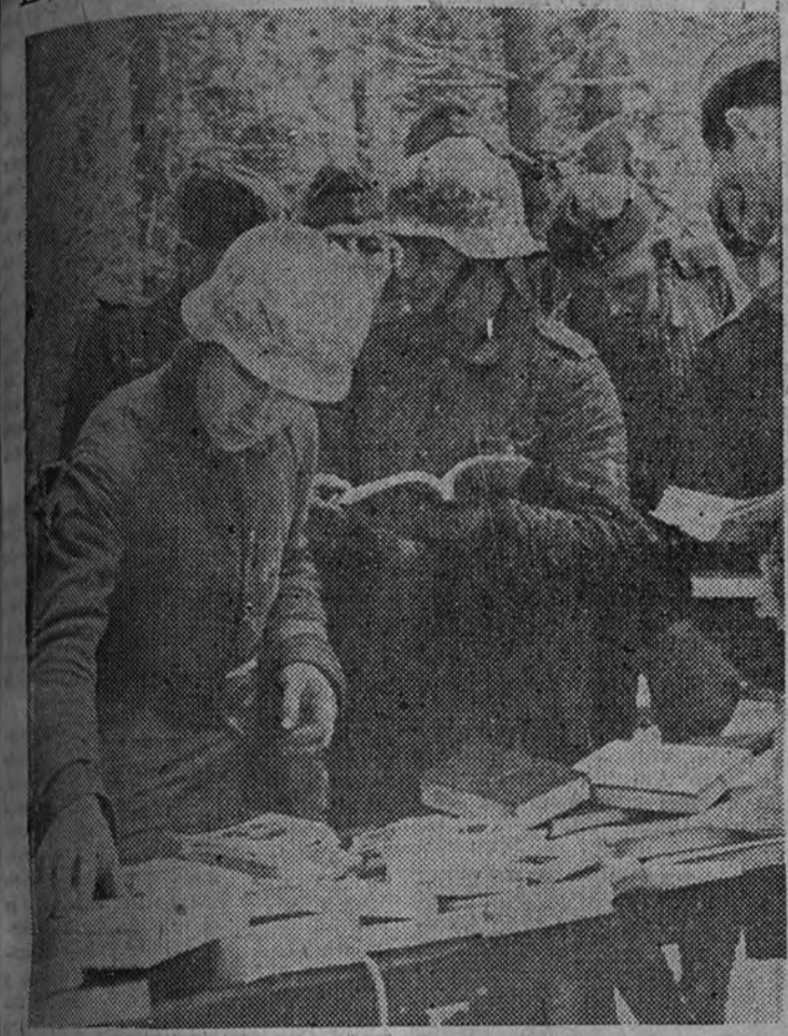
A las líneas del frente del norte acaba de llegar un avión con libros para las fuerzas, y los soldados del Reich allí destacados se apresuraron a elegir sus autores predilectos.