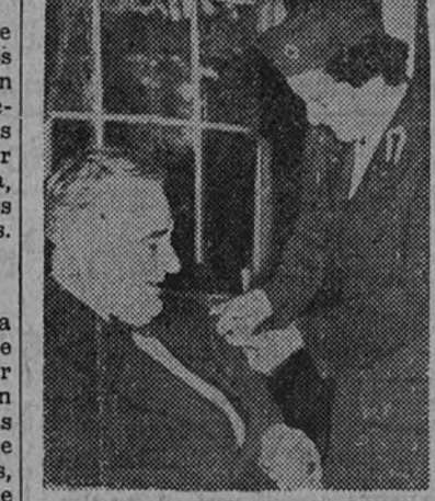
Un enfermera de la Cruz Roja americana imponiendo una insignia de la institución al Presidente Roosevelt por sus esfuerzos en pro de la Cruz Roja.

tierra, infligiendo al enemigo elevadas pérdidas en hombres y en material.