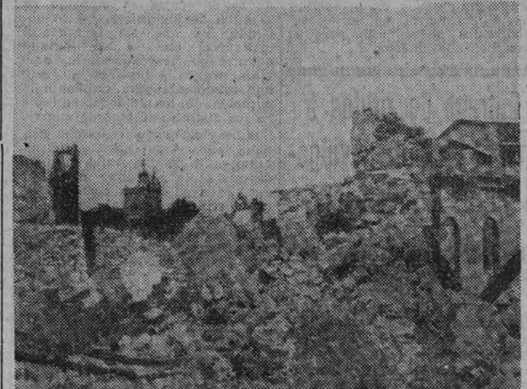
Una vista de la ciudad de Irún, destruida por los rojos en su retirada

Asistió a ella el director general de Regiones Devastadas