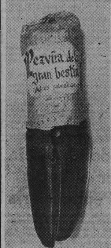
Un fármaco del siglo XVII

Son las tierras de Fernán González—un paso al Norte. Covarrubias—, y mi camino baja hacia el agustino monasterio de La Vid. A la izquierda, por San Esteban de Gormaz, queda Soria. Mil atajos me llevan, sin querer, a la roca tensa de mi Extremadura.