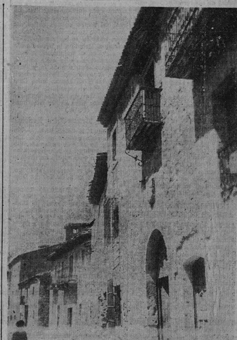
La calle de la Botica, en Peñaranda de Duero

Y por mis manos van pasando los jácintos, con su misión de dulzar y absorber humores; el topacio, de propiedades cordiales, usado contra la melancolía y mal de ojo; los corales, para alegrar la sangre; el ámbar gris, como desecante y resolutivo, especialmente recomendado en las mu-