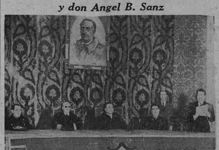
El Ministro de Justicia, señor Aunós, presidiendo la solemne sesión inaugural del curso de Estudios Penitenciarios, celebrado en el Paraninfo de la Universidad Central