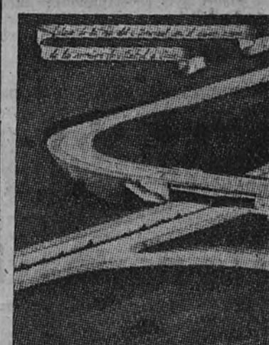
Una de las soluciones propuestas al problema de los accesos por carretera a Madrid

La estación de clasificación de Fuenca-rral se halla en período de ejecución.