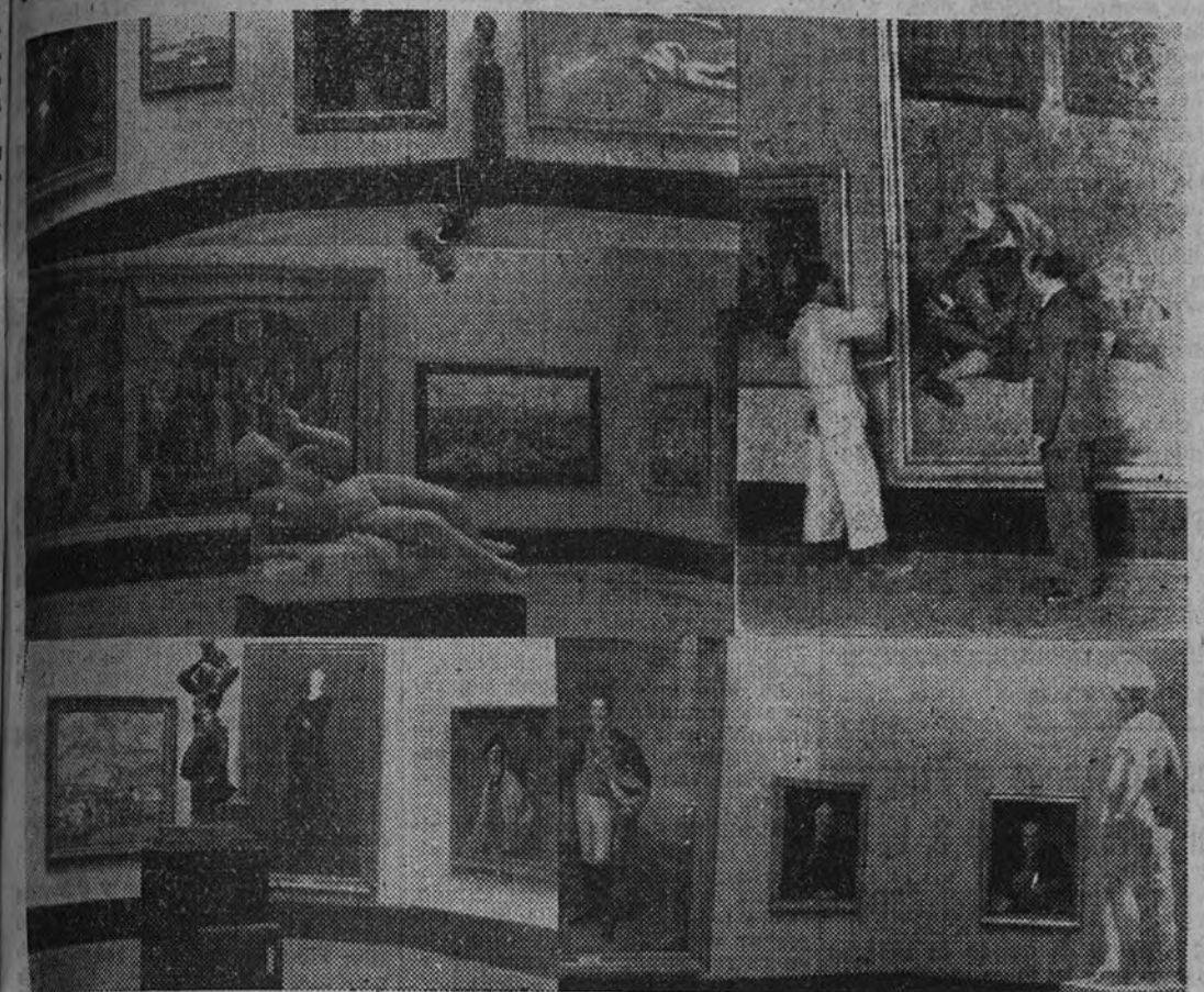
Un aspecto de las nuevas salas del Museo de Arte Moderno

Numerosos lienzos nuevos, un gran salón de escultura y varias exposiciones monográficas