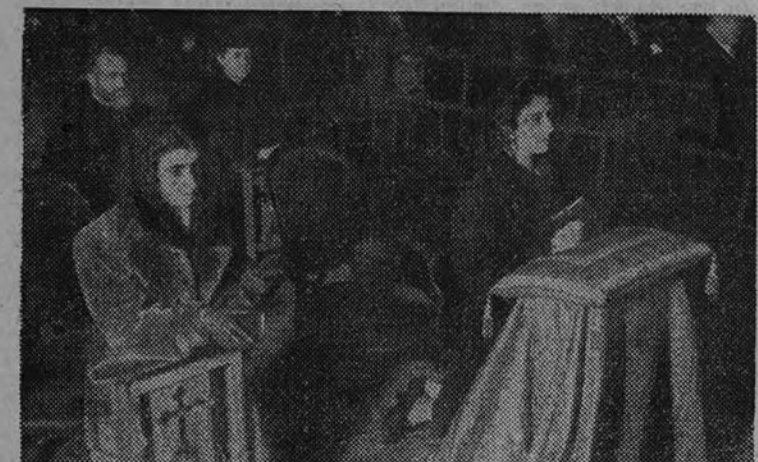
La esposa del Caudillo y su hija, la señorita Carmen, orando ante la venerada imagen de Jesús

El Presidente de las Cortes y los Ministros de Justicia, Ejército, Educación, Agricultura, Marina y Obras Públicas estuvieron también en la iglesia de Jesús