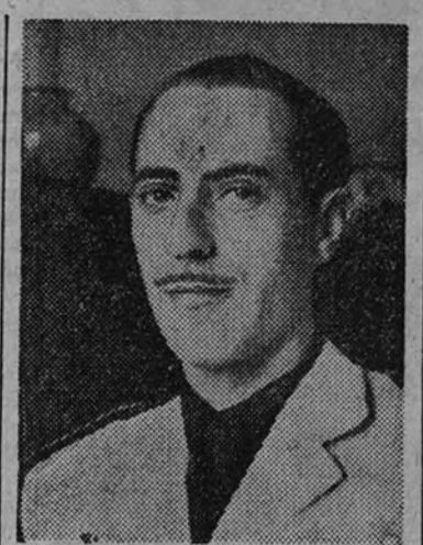
José María Rodríguez de Valcárcel