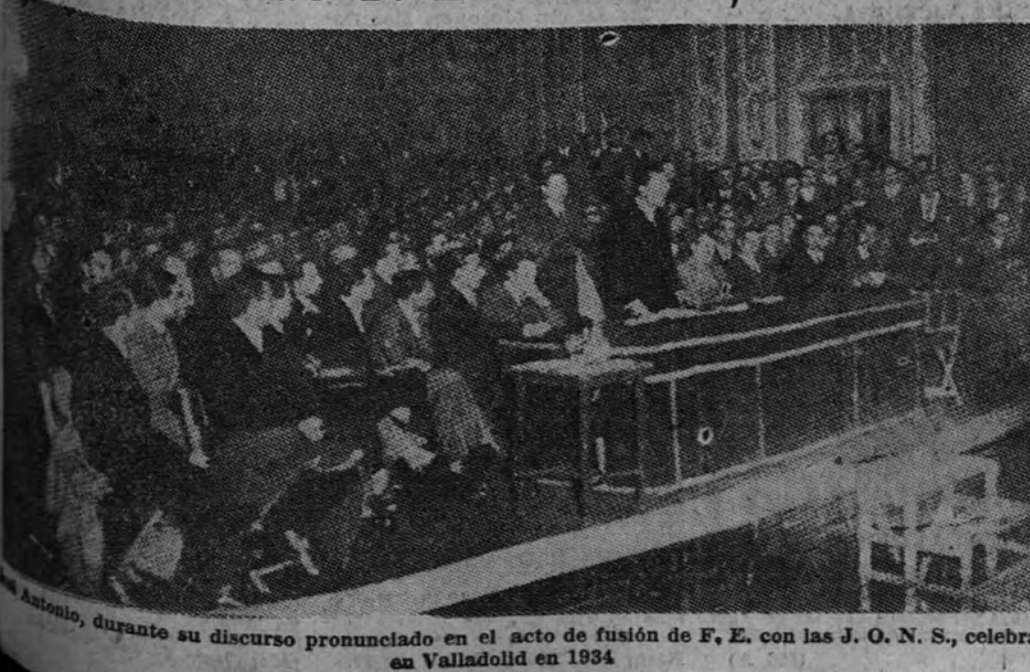
En Valladolid, durante su discurso pronunciado en el acto de fusión de F. E. con las J. O. N. S., celebrado en Valladolid en 1934.