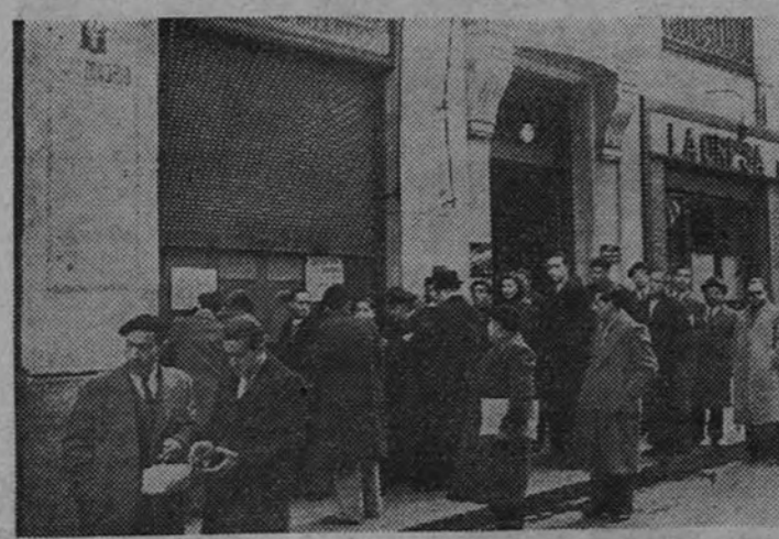
El público, estacionado en larga cola ante el despacho de localidades de la Empresa de la Plaza de Toros madrileña, para la renovación de los carnets de reserva de localidades.