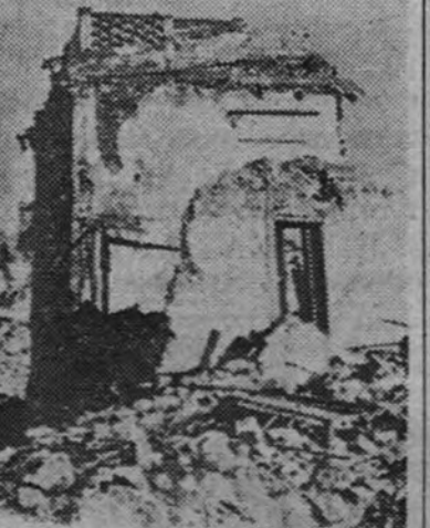
Las fuerzas germanas están defendiendo la ciudad de Cassino

de no lo reconociera, se aprestan espontáneamente a defenderse de los soviets como no es fácil, pero tampoco es imposible. En más de veinte años ha trabajado Stalin por extirpar toda manifestación de espíritu humano, todo anhelo espiritual, mucho en este aspecto. Todo allí está sacrificado al poderío militar, a la guerra, a la fuerza material. Toda actividad rusa la vuelve Stalin en los preparativos guerreros. Y, sin embargo, cuando el Ejército alemán se enfrentó con el ruso se produjo una campaña afortunada para los alemanes, comparable a las más brillantes de la historia. Hoy, ciertamente, los alemanes se retiran. Se retira una mínima parte de su Ejército, que es el que lucha con todo el Ejército ruso completo, contra todas las armas rusas y contra los importantes envíos que los soviets reciben de los americanos.