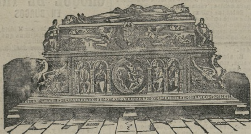
Sepulchro de D. Juan II en Miraflores.

Muy cerca del ferro carril, á cuatro kilómetros de Burgos, se halla el convento de Miraflores, fundado sobre el solar de un palacio de Enrique III, para que sirviera de panteón real, y se terminó en tiempos de Isabel I.