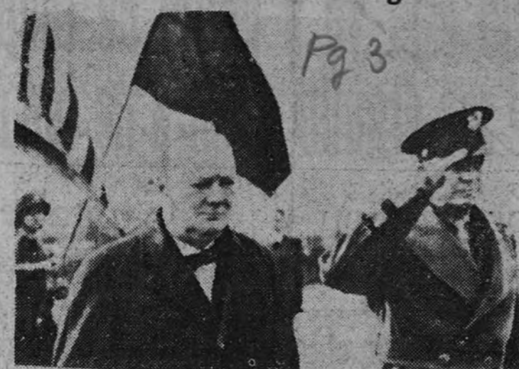
El primer ministro inglés, Mr. Churchill, con el general Eisenhower, revisando las fuerzas concentradas en "un lugar de Inglaterra" en preparativos para el asalto al Continente.