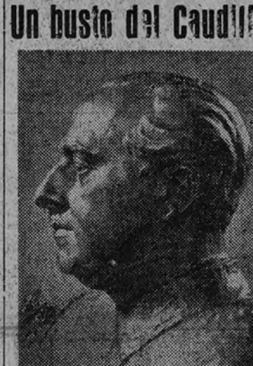
«Su Excelencia el Generalísimo», obra de Juan Avelos, costada por los obreros y empleados de la RENFE, Zona 18, con destino a su salón de actos