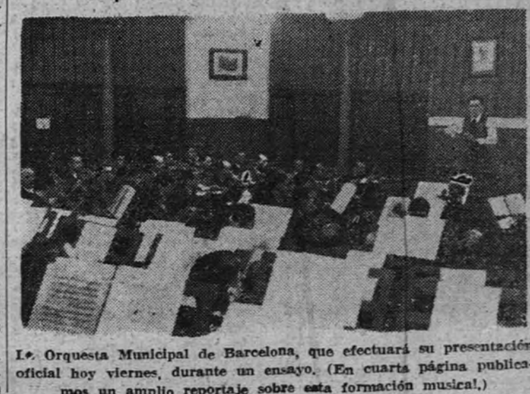
La Orquesta Municipal de Barcelona, que efectuará su presentación oficial hoy viernes, durante un ensayo. (En cuarta página publicamos un amplio reportaje sobre esta formación musical.)