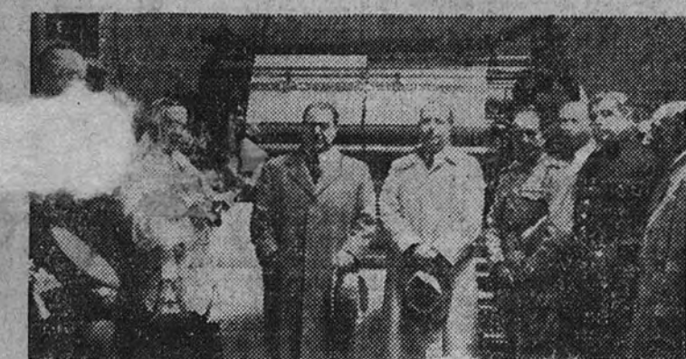
En la Prisión de Alcalá de Henares se ha inaugurado la Escuela de Capacitación de Artes Gráficas. El Subsecretario de Justicia y el director general de Prisiones, camaradas Gómez Gil y Angel B. Sanz, con otras autoridades y jerarquías, en la bendición de la rotativa instalada en la Escuela.

Pronunciaron discursos el Subsecretario de Justicia y el director general de Prisiones