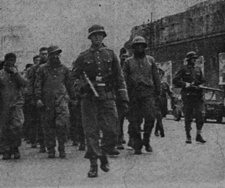
ducen por las calles de Roma un grupo de prisioneros del Ejército aliado, capturados en los combates de Cassino.