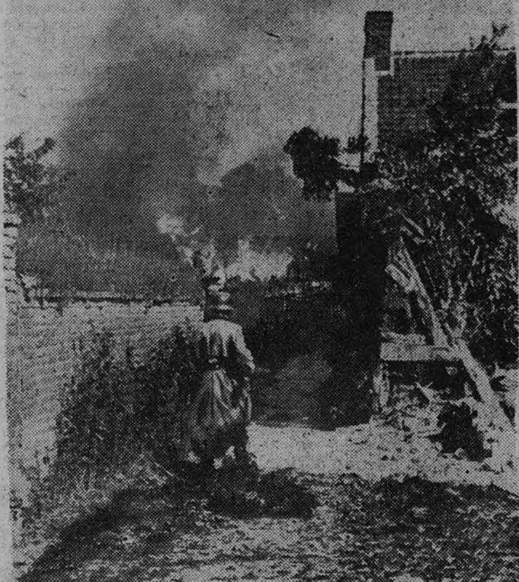
Entre las ruinas de los edificios, ardiendo aún, de una ciudad italiana atacada por las tropas aliadas, los alemanes, parapetados tras los humeantes muros, hacen una tenaz defensa del terreno