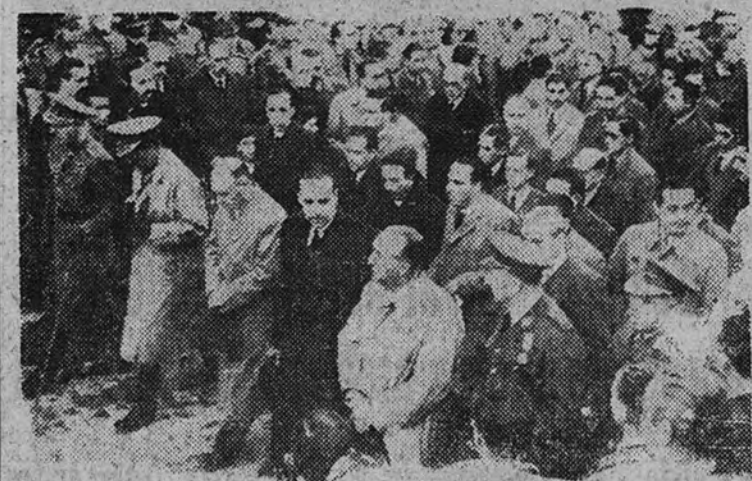
La presidencia del duelo, en la que, con el director General de Seguridad, figuran el Ministro de la Gobernación, el Subsecretario del mismo Departamento, el Alcalde de Madrid y otras personalidades, (Foto Contreras.)

Fué presidido por el Ministro de la Gobernación