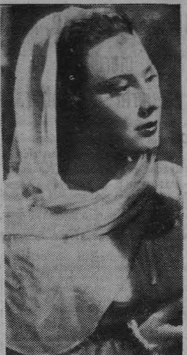
Lida Barova en el papel de Margarita Luti, de la gran superproducción cinematográfica "La Fornarina", próximo programa del cine Rialto

El día 15, sin embargo, es posible que haya boxeo en Madrid. No comenzará todavía el torneo de los ligeros, que se está preparando ya, pero será una velada de cierta categoría.