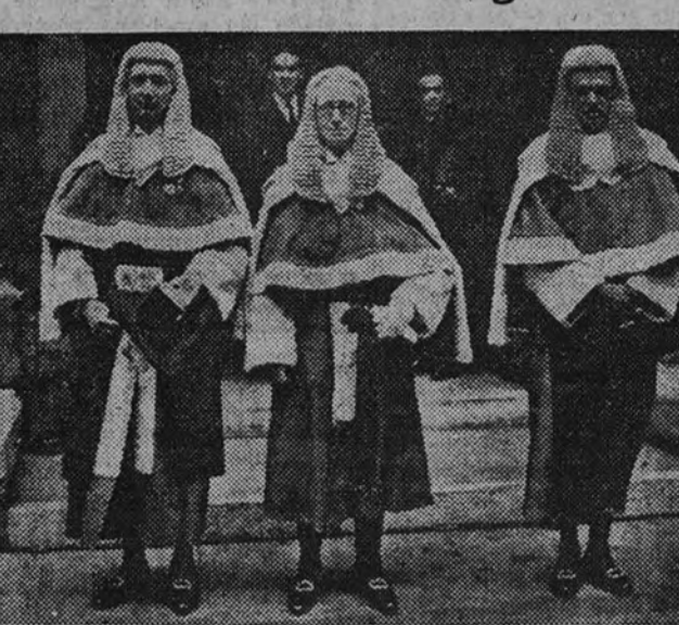
El Rey de Inglaterra acaba de conceder el honor de ser armados "caballeros", para señalar su nombramiento como jueces del Tribunal Supremo, a Mr. Alfred Thompson Denning, Mr. Hubert Joseph W. Illington y Mr. Henry William Barnard, Scrán agregados a "Testamentarias", "Divorcios" y "Alimentación".