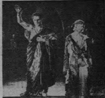
Fotograma de "El Rey de Reyes", la impercedera realización cinematográfica de Cecil B. de Mille

rector Garson Kanin ha sabido aprovecharlo. Del naufragio de una expedición científica sólo logran salvar su vida, arribando a una isla desierta en la que permanecen siete años, la esposa de un jurista y un compañero de investigaciones.