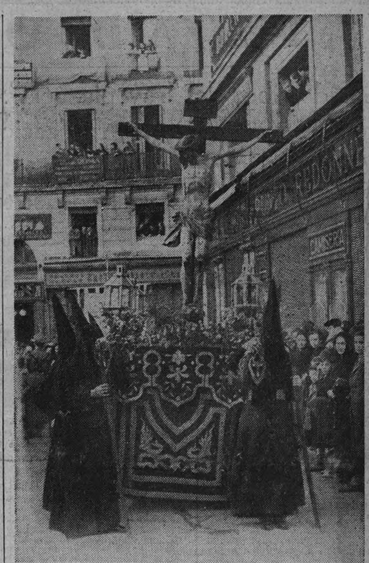
Imagen de Jesús Crucificado, que figuró en la procesión del Rosario de Penitencia