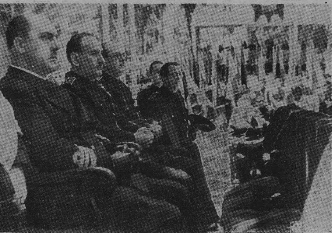
Los Ministros Secretario General del Movimiento, Educación Nacional y Marina durante la misa de despedida celebrada en Murcia con motivo del desfile de la Falange