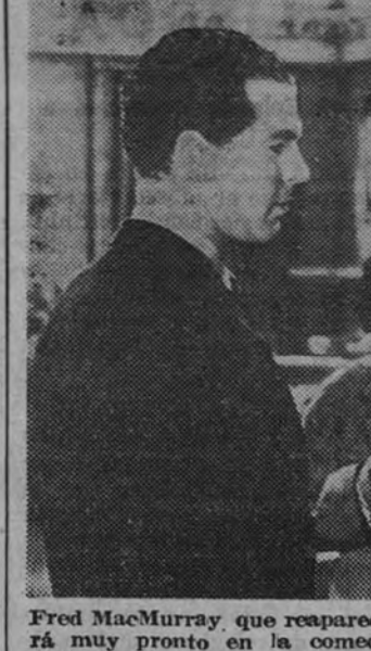
Fred MacMurray, que reaparecerá muy pronto en la comedia «Locuras de millonarios».