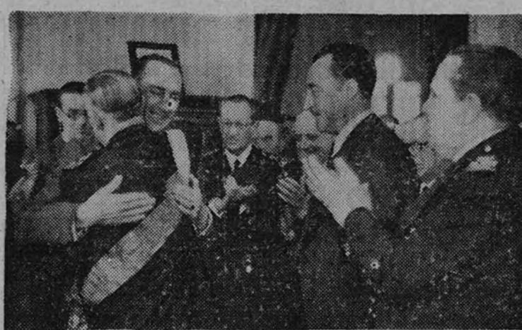
El Ministro de Agricultura, camarada Miguel Primo de Rivera, momentos después de imponer la Gran Cruz del Mérito Agrícola al presidente del Consejo Agronómico y director del Instituto de Investigación Agronómica, D. Pedro Gordón

Le impuso las insignias de la Gran Cruz del Mérito Agrícola el Ministro de Agricultura