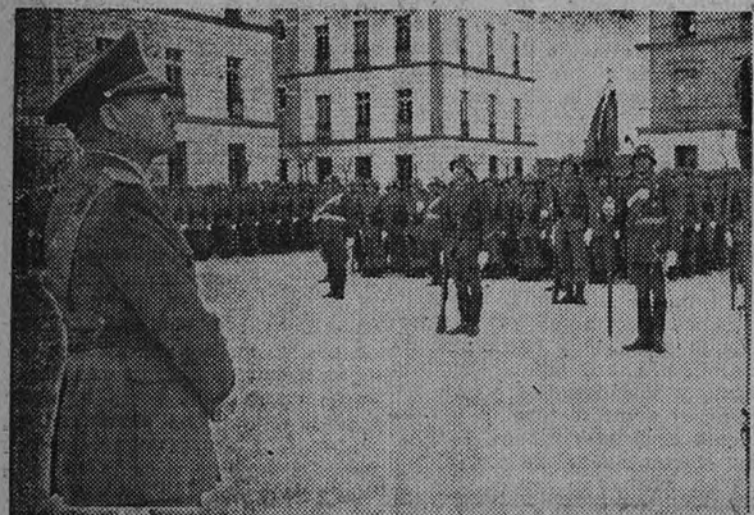
El Ministro del Ejército durante su discurso