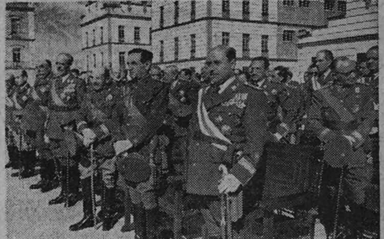
El Ministro del Ejército con los generales que asistieron a la imposición de distintivos a los supervivientes del regimiento de Transmisiones de El Pardo

RIO DE JANEIRO 17.—“¿Cree usted que las vacas son tontas?”. Esta pregunta es la que formuló un funcionario de la Oficina de Patentes y Marcas de esta capital a un supuesto inventor, que se presentó a registrar una especie de grandes anteojos de cristal verde para colocárselos a las vacas en tiempos de sequía, con objeto de que los animales coman los pastos de hierba seca creyendo que son frescos. El inventor insistió en que su procedimiento había sido comprobado como eficaz y la Oficina de Patentes ha accedido a presenciar algunas experiencias. (Efe.)