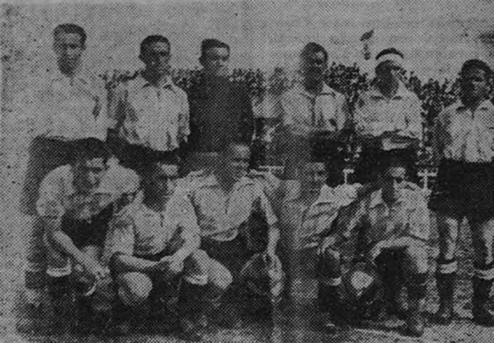
El Deportivo de La Coruña, que resolvió fácilmente su papeleta de promoción ante el Constanica y, que, por tanto, sigue en la categoría de honor