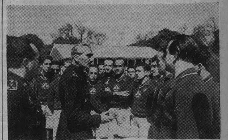
El Delegado Nacional del Frente de Juventudes explica la primera lección en el Campamento Nacional de Jefes de Campamentos, en el que están representadas todas las provincias de España

En la Casa de Campo se verificó la inauguración del Campamento-Escuela Nacional para Jefes de Campamento e Instructores de Marchas de las Falanges Juveniles de Franco. Asistieron al curso, que durará diez días, cien camaradas de todas las provincias españolas.