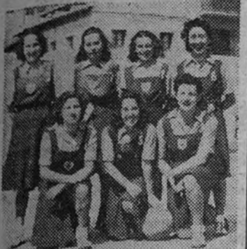
El equipo del Centro de la Sección Femenina, gran favorito del Campeonato nacional que empieza mañana

Continuará el domingo día 30 el Campeonato nacional de baloncesto.