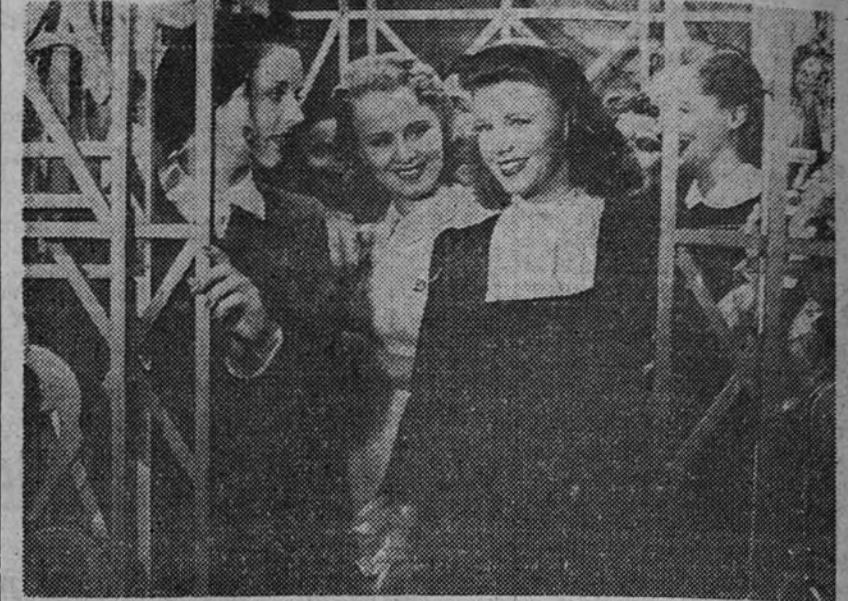
Ginger Rogers, en una de las más interesantes escenas de «Espejismo de amor» («Kitty Foyle»), por cuyo trabajo fué considerada por la Academia de Artes y Ciencias Cinematográficas de Hollywood como la mejor actriz de 1941