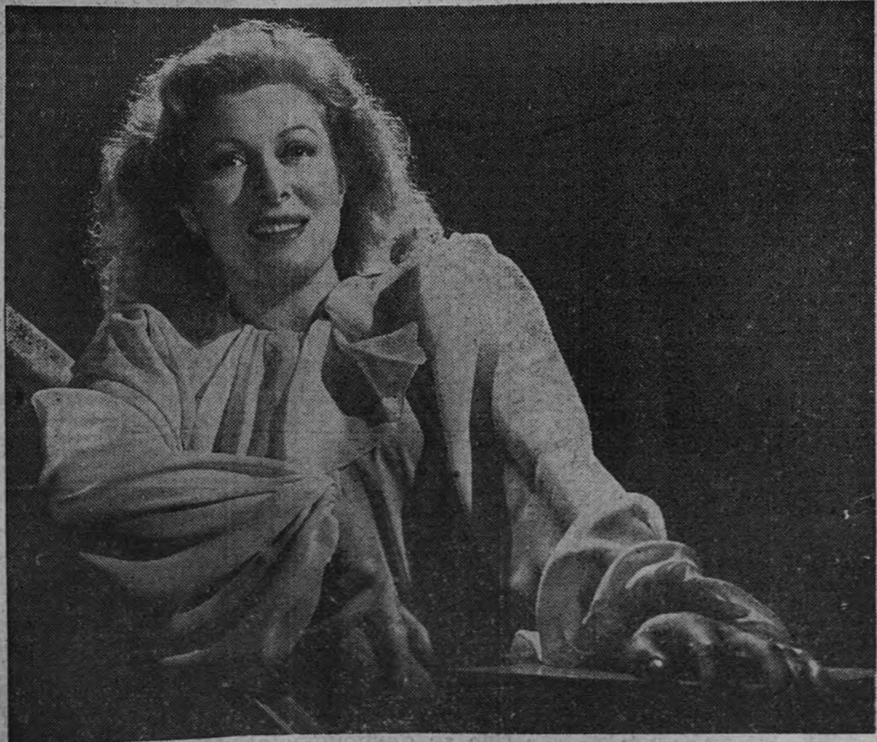
Gree Garson, premiada el año 1943 por la Academia de Hollywood por su magnífico trabajo en «Miss Minniver», la cual goza de una extraordinaria popularidad en América, y que actuará como protagonista de «Mrs. Parkington», nuevo film que se comenzará en breve, cuyo argumento está inspirado en la novela del mismo título de Luis Bromfield