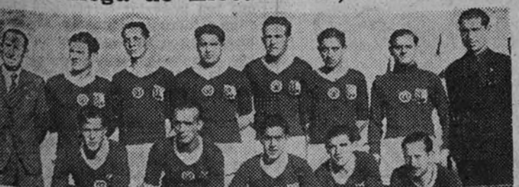
El equipo de la Sociedad Gallega de Electricidad, de Vigo, que al vencer al Carbonell se clasificó finalista del Campeonato nacional de Educación y Descanso

Altos Hornos de Sagunto y Sociedad Gallega de Electricidad, finalistas