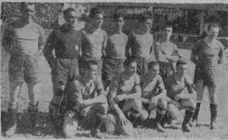
El equipo de El Ferrol del Caudillo, que después de vencer al Arenas, pasa a la segunda categoría nacional

Y así se gastaron los quince primeros minutos de gran juego; gran juego que luego se estufó. El Ferrol comenzó a absorber al Arenas hasta que, cuatro minutos antes de acabar, un fallo del medio derecho puso a tiro al extremo izquierdo ferrolano un balón, que, con el efecto del fallo, lo remató, con el efecto del fallo, lo remató por el ángulo de modo imparable. Fue el único gol de la tarde. Y el ascenso del Ferrol a Segunda División. El Arenas descendía otro, a Tercera División.