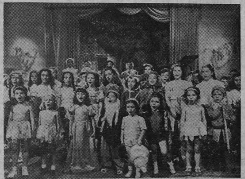
Cuando los «extras» son niños, su intervención alcanza momentos de encantadora sugestión...

Para acabar de hablarles de los «extras» yo les voy a dar a ustedes una regla muy útil para distinguir a los figurantes y no confundirlos con los artistas si éstos no se conocen. He aquí la regla: Si ustedes ven en algún Estudio, ya sea en los escenarios, ya en los pasillos, en los jardines y en el bar, a ciertos individuos pintados de color salmónete, seguro es que posan ante la pantalla. Ahora bien, si estos camaradotes llevan un habérillo colgado alrededor del cuello, tengan ustedes por seguro que son «extras» que no quieren que se les estropee el traje mientras esperan la voz del director que les ordene volver al escenario.