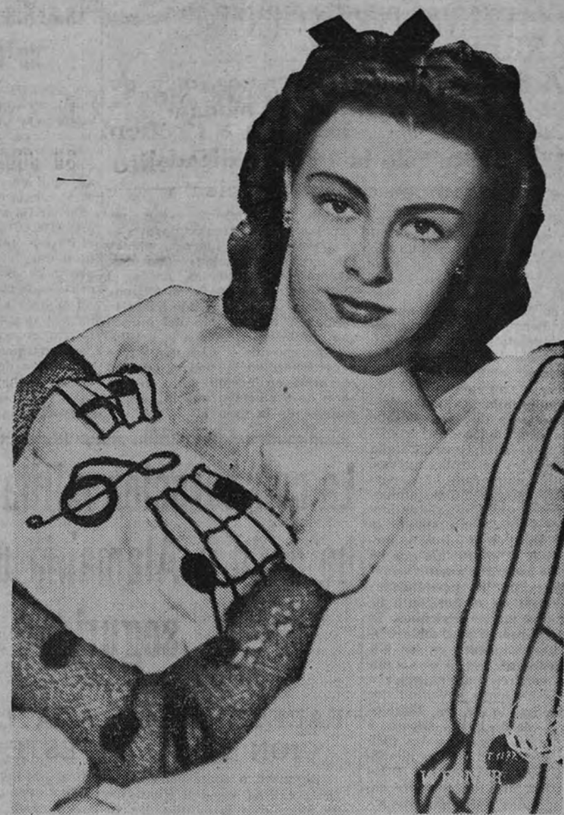
Ilse Werner es una de las estrellas más populares en Alemania. Nosotros añadimos: y más guapas. Digalo si no este expresivo plano de «Hagamos música», película que muy pronto será presentada en las pantallas españolas