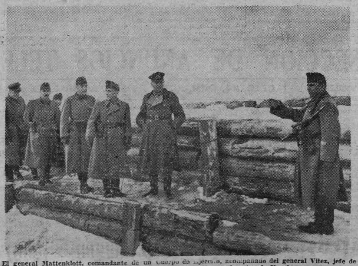
El general Mattenklott, comandante de un cuerpo de ejército, acompañado del general Vitez, jefe de una división húngara, visitan una posición en el sector de Kovel