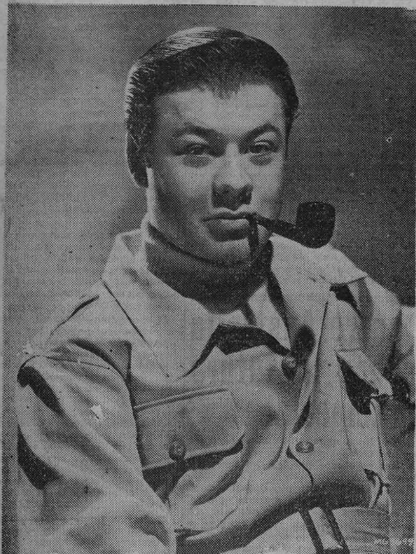
He aquí el rostro de un nuevo «mal» que se ha asomado recientemente por vez primera a las pantallas norteamericanas. Se trata de Turhan Bey, inteligente actor al que, según leemos en una información de aquel país, le espera un brillante porvenir por su sencilla y natural manera de actuar ante la cámara