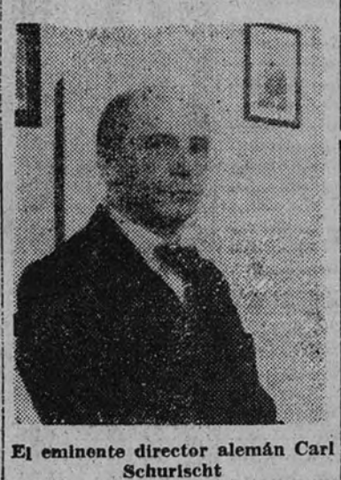
El eminente director alemán Carl Schurisch

Cuando llegó al edificio en donde de la Orquesta Nacional—como la Filarmónica, la Sinfónica y la Banda Municipal—celebran sus ensayos, sufrió la impresión que siempre se añade de mí al llegar al local. Atmosfera cargada por el humo de cientos de cigarrillos que