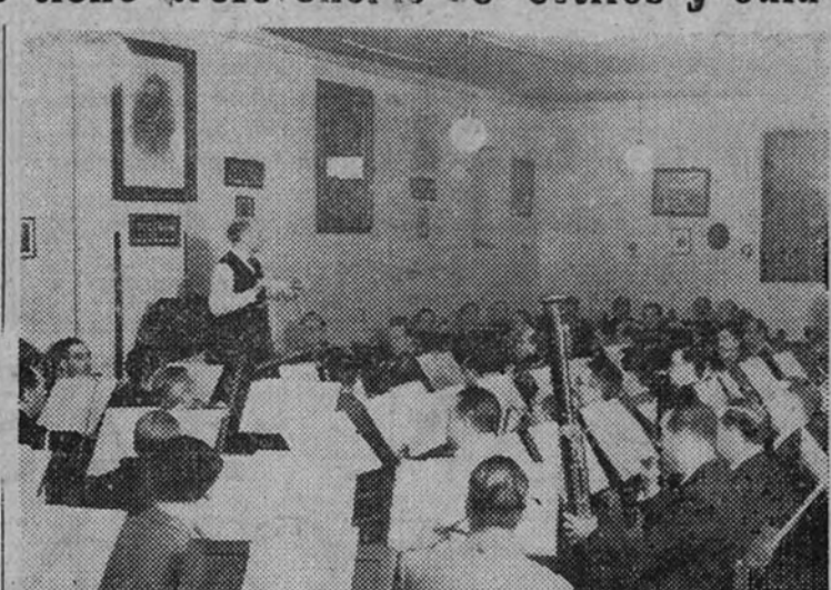
El maestro, en un ensayo al frente de la Orquesta Nacional

La industria nacional está representada por diversas regiones, como Castilla, en la que sobresale la provincia de Valladolid con sus diversas industrias típicas, como, por ejemplo, la cerámica, maquinaria y productos agrícolas.