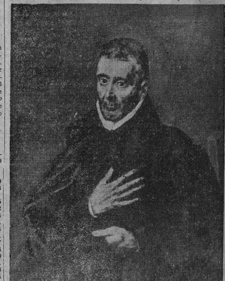
Retrato de Juan de Avila, por el Greco.

unipersonal y gigantesca, a la vez, de mover la conciencia de los principales y de las multitudes, y si bien su época era propicia a las grandes empresas de la espiritualidad, si los Monarcas iluminaban su tarea con la luz de la fe que alumbraba la incorporación de un nuevo mundo a la vida de la gracia y de la plenitud del ser social, el encauzamiento, la superestructura de esa conciencia y de esa tarea imperiales precisaban de almas locales como la de Juan de Avila, superadoras de lo contingente, encarriladas con lo eterno. Y como la avasalladora corriente del apostolado personal de Juan de Avila fué el ejemplo, y su ejemplo arrancaba de la superior moción de su alma privilegiada, pero no se aislaba de la empresa generosa que alentaba los destinos patrios, a fuer de español de su siglo, enamorado de la conquista de las almas de allí, antes de las de aquí, cuando tenía treinta años, recientemente ordenado, pide al obispo de Tlaxcala