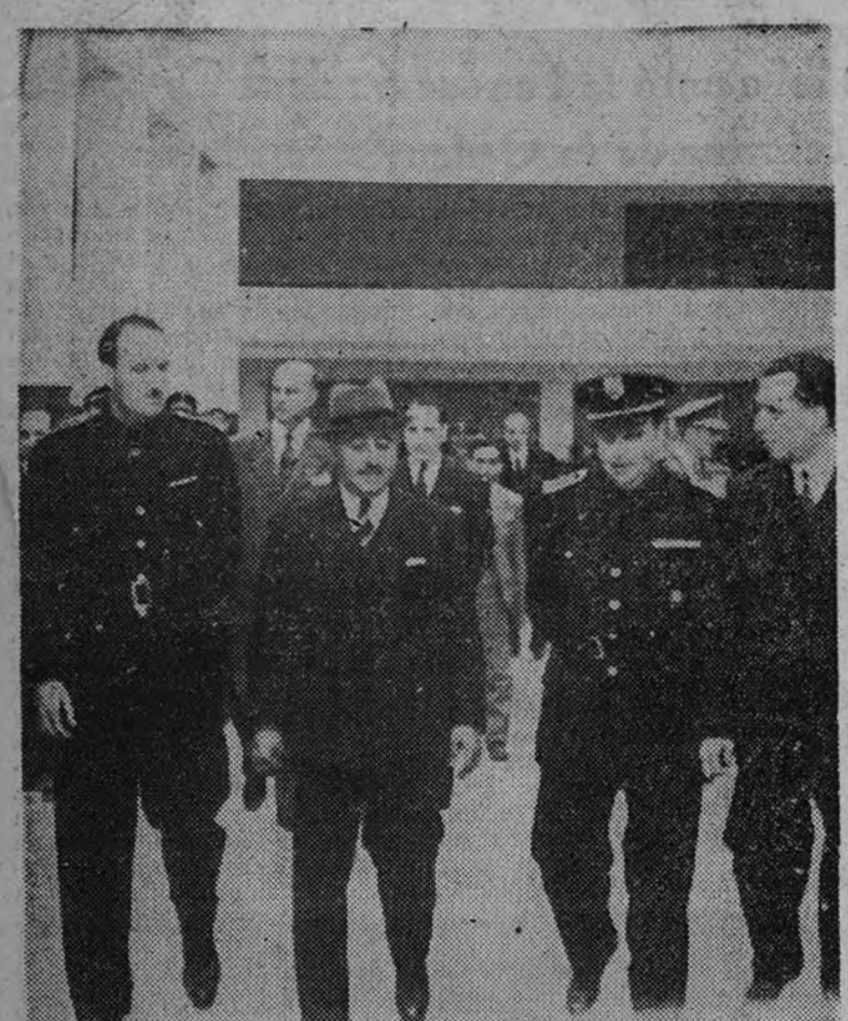
Su Excelencia visita el Mercado de Entrenadores.