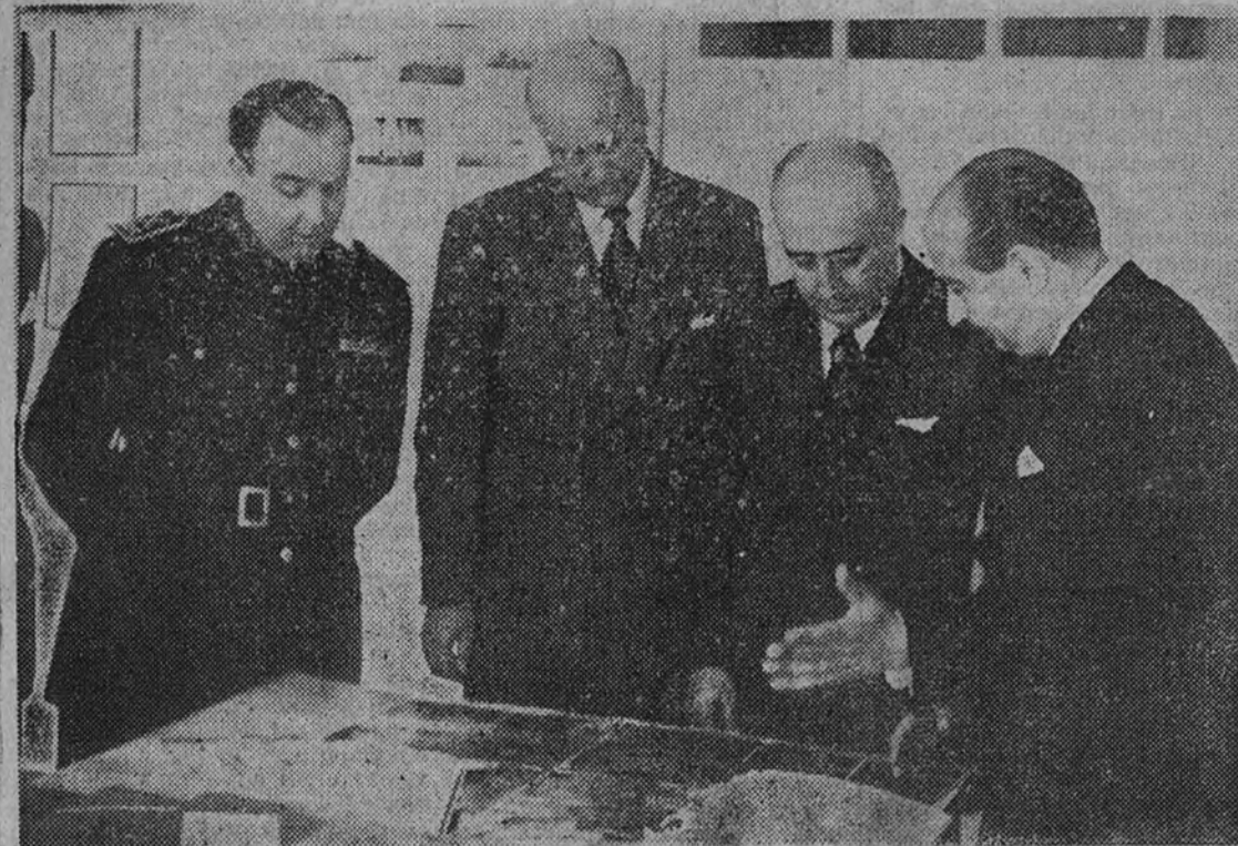
El Caudillo examina los proyectos de obras de la Diputación Provincial

En el Alcázar ofreció el Generalísimo una comida de gala a las autoridades sevillanas