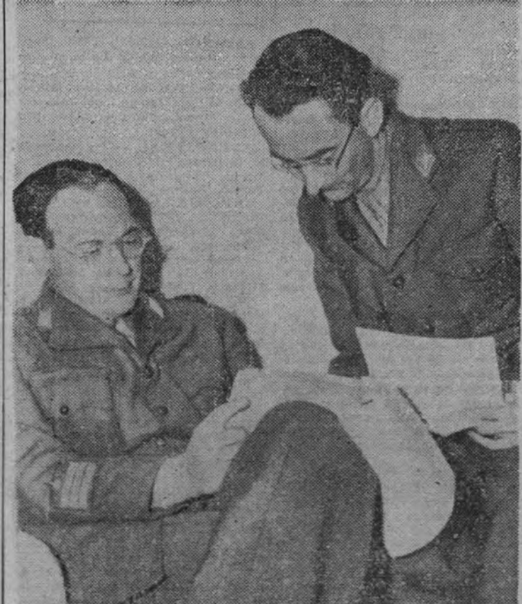
El general de división Valcárcel (izquierda) y el comandante Valgenik, representantes militares de Tito, que se encuentran en la capital británica para reanudar las conversaciones comenzadas en Africa del Norte con las autoridades inglesas. (Foto transmitida por radio.)