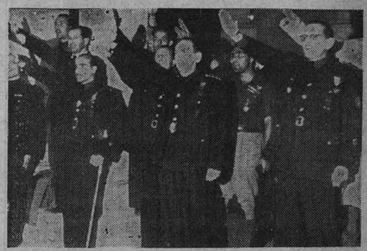
El Ministro Secretario General del Movimiento, acompañado del Gobernador y Jefe Provincial de Madrid y otras jerarquías, cantan el Himno a la Falange en el acto de recibir a los camaradas de la Vieja Guardia de Alicante

Fueron recibidos por el Ministro Secretario General del Movimiento y otras jerarquías