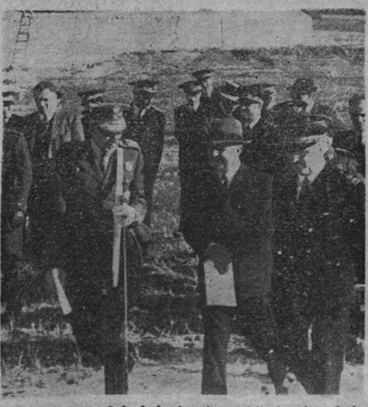
El Caudillo, acompañado de los ingenieros, visita las obras de los riegos del bajo Guadalquivir.

WASHINGTON 10.—James Forrestal ha sido nombrado ministro de Marina de los Estados Unidos, sucediendo al coronel Knox, recientemente fallecido. Forrestal tiene cincuenta y cuatro años de edad y desde 1940 desempeña el cargo de subsecretario de Marina. Pertenece al partido demócrata y ha contribuido grandemente a la rápida expansión de la Marina de los Estados Unidos. (Efe.)