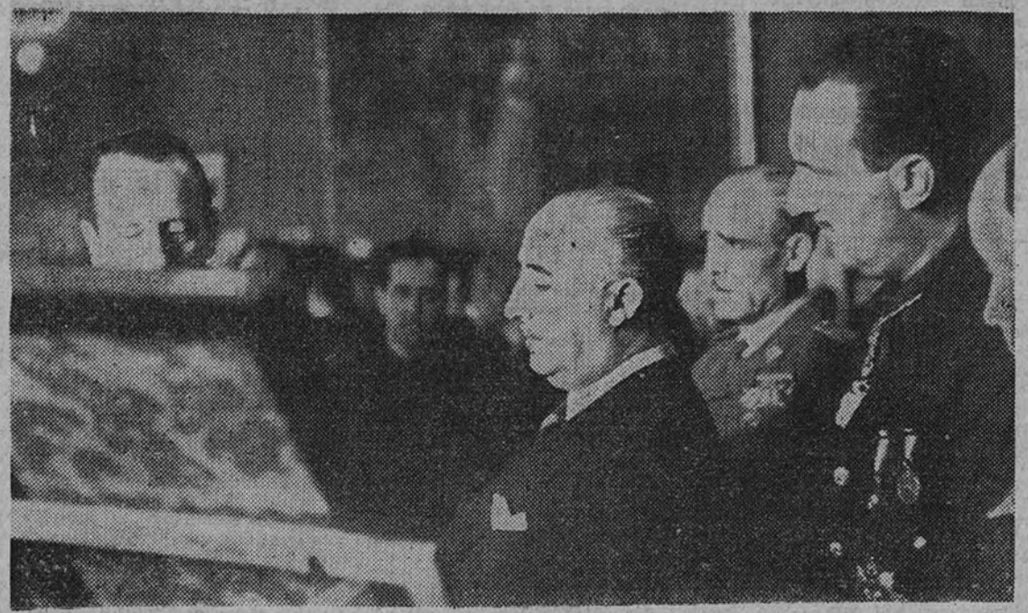
El Caudillo, con el Alcalde de Sevilla, en la visita inaugural a la Exposición del Libro del Caballo que se celebra en el Ayuntamiento

Una gran muchedumbre rodeó el coche del Generalísimo para hacerle objeto de la más efusiva manifestación de cariño