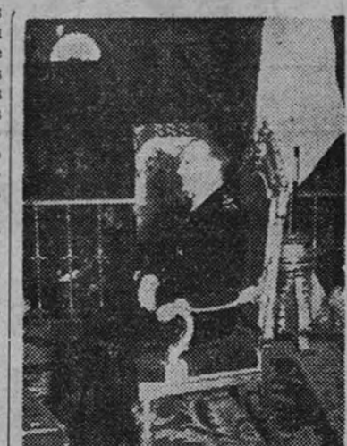
El Ministro de Obras Públicas preside la función religiosa