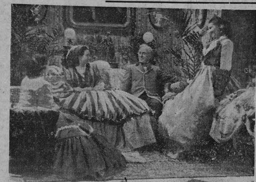
Una escena de la película histórica «Eugenia de Montijo», que tiene por escenario el Palacio de Ariza

—¿Qué defectos? ¿Que gastaba mucho en trajes, que derrochó algún dinero? ¿Y qué es eso comparado con