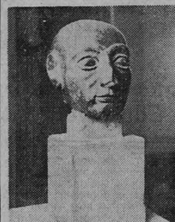
Una de las obras del legado Zayas, que figura en las nuevas instalaciones

Tablas de Morales, Correa, Claudio Coello, Juan de Juanes e hispanoflamencos; la colección numismática donada por Bosch; lienzos de la Escuela de Retratisas de la Corte, estatuas y otras interesantes obras se recogen en las mismas