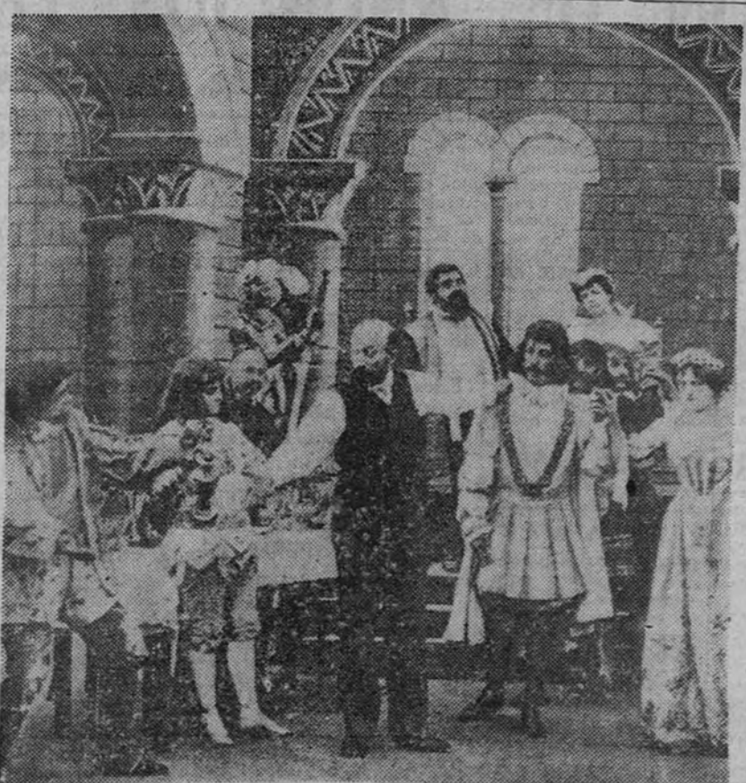
Georges Méliés dirige uno de sus primeros films, de ambiente histórico

Mercantilizado formidablemente el cine, elevado a la categoría de una potente industria, el empuje financiero de sus nuevas organizaciones eliminó a Méliés, que murió en París, completamente arruinado, una triste noche invernal de 1933, en vísperas de cumplir los setenta y ocho años de su fervorosa vida de trabajo.