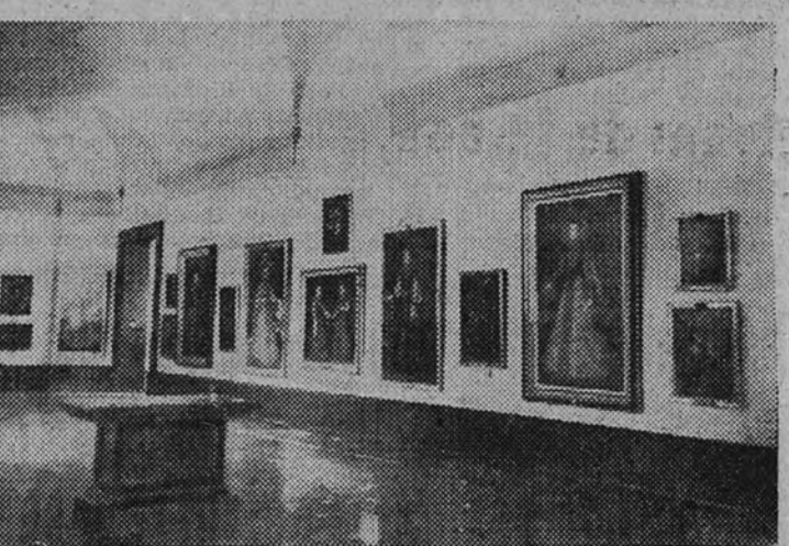
Vista de una de las nuevas salas