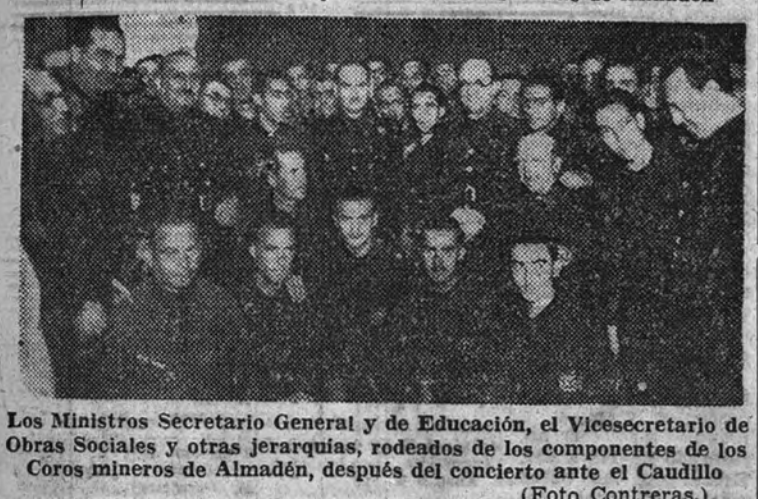
Los Ministros Secretario General y de Educación, el Vicepresidente de Obras Sociales y otras jerarquías, rodeados de los componentes de los Coros mineros de Almadén, después del concierto en el Palacio de El Pardo.