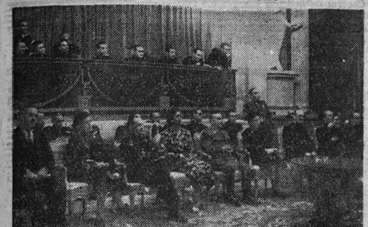
El Caudillo, con su esposa, los Ministros Secretario General, de Trabajo y de Educación Nacional, Pilar Primo de Rivera y otras jerarquías, escuchando el concierto que en el Palacio de El Pardo dieron ayer tarde los Coros de Educación y Descanso de las Minas de Almadén.

Al acto, celebrado en el salón-teatro de El Pardo, asistieron los camaradas Arrese, Girón e Ibáñez Martín