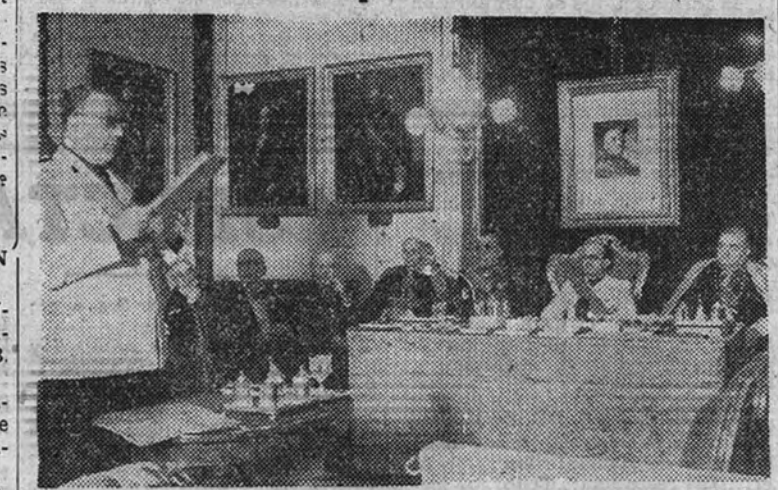
El Ministro de Justicia, camarada Aunós, leyendo su discurso de ingreso en la Academia de Ciencias Morales y Políticas.

«La política social de la Dictadura» fué el tema desarrollado por el nuevo académico