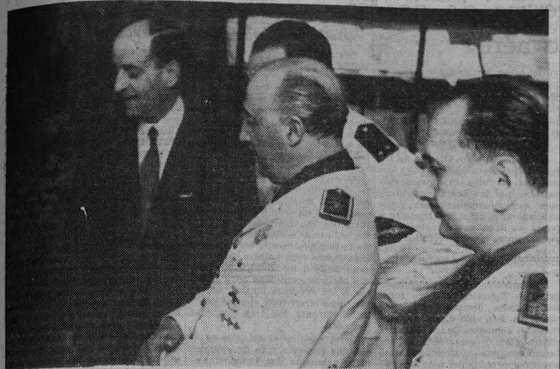
El Generalísimo visita la Exposición Histórica del Libro Español