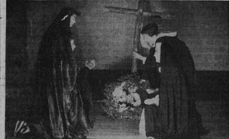
Un escena del primer acto, llena de gracia y emoción

ASISTIO EL DELEGADO NACIONAL DEL FRENTE DE JUVENTUDES E HIZO LA PRESENTACION GIMENEZ CABALLERO