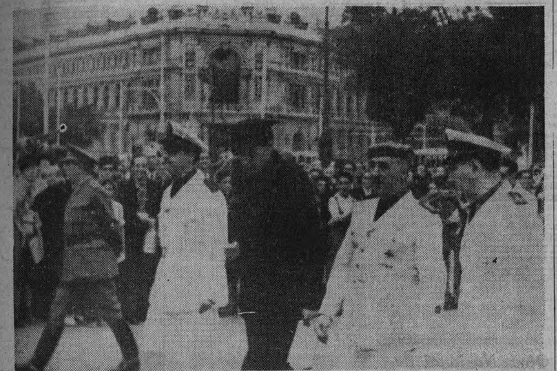
Su Excelencia el Jefe del Estado español, recorre a pie las calles de Madrid para llegar a la instalación de la Feria del Libro

El público, numerosísimo, aclamó con todo entusiasmo al Caudillo de España