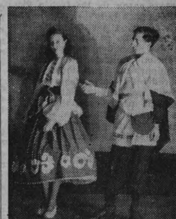
Un momento del «Diálogo del Nacimiento», del primer acto de «El misterio español de Cristo»