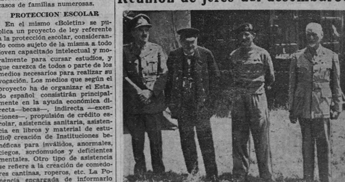
Mister Churchill, acompañado del general Smuts, jefe del Gobierno del África del Sur, y los generales Montgomery y sir Alan Brooke