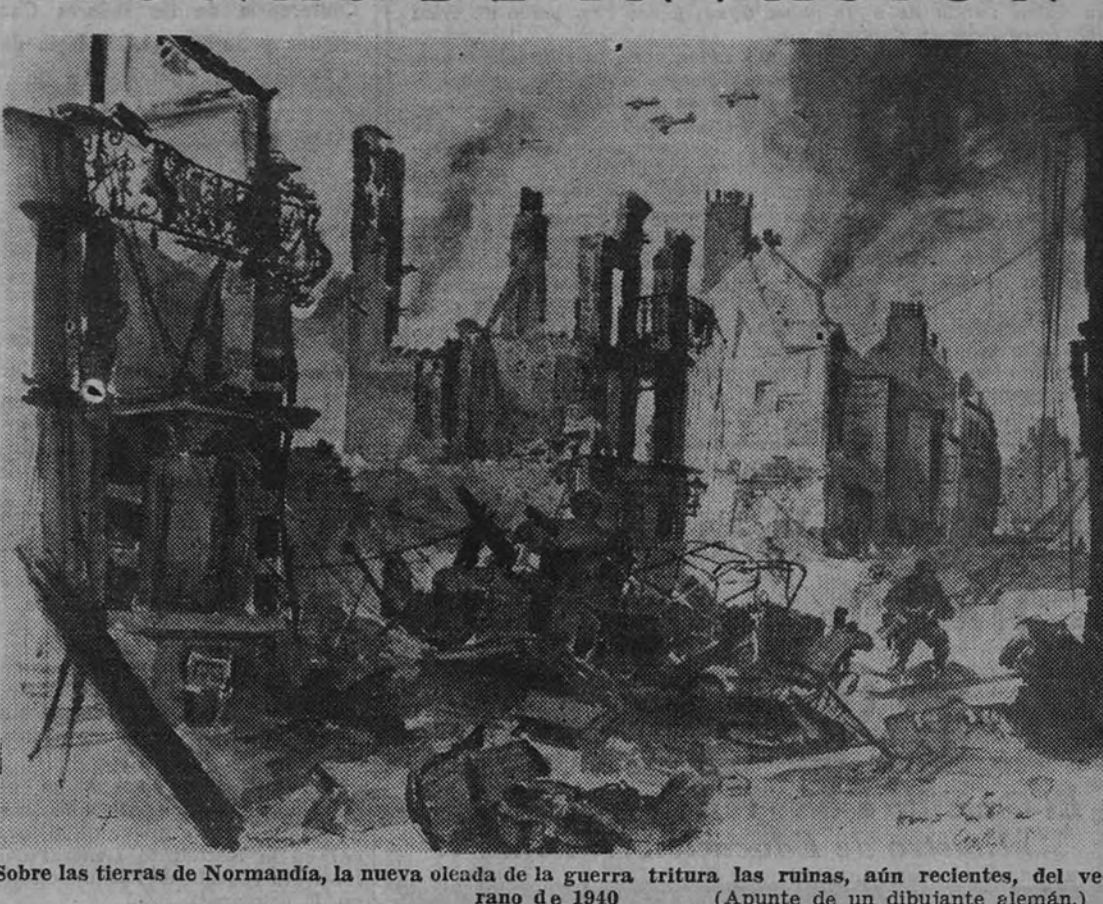
Sobre las tierras de Normandía, la nueva ola de la guerra tritura las ruinas, aún recientes, del verano de 1940. (Apunte de un dibujante alemán.)