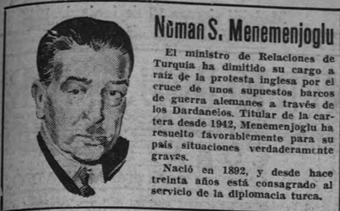
Norman S. Menemenjoglu

El ministro de Relaciones de Turquía ha dimitido su cargo a raíz de la protesta inglesa por el cruce de unos supuestos barcos de guerra alemanes a través de los Dardanelos. Titular de la cartera desde 1942, Menemenjoglu ha resultado favorablemente para su país situaciones verdaderamente graves. Nació en 1892, y desde hace treinta años está consagrado al servicio de la diplomacia turca.