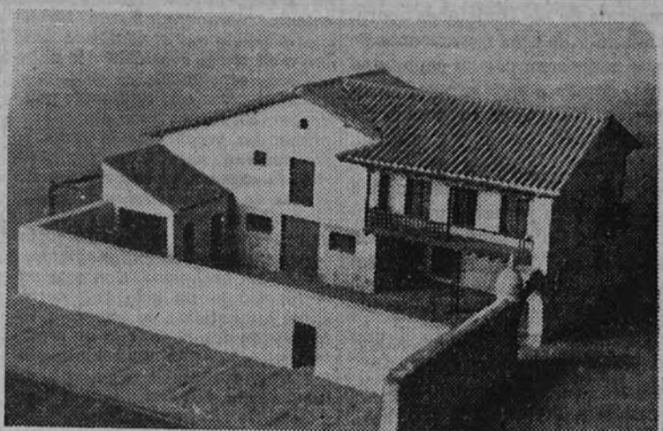
Construcción aislada sobre unas parcelas que corresponden a un grupo de viviendas en cuyas tierras hace muy poco tiempo se alzaban grupos de chozas como las que ofrecemos más arriba

plimiento de un deber, sino en función de un servicio ejercido con la ilusión de contribuir al engrandecimiento de España, se lleva a cabo la delicada misión, con un tacto y con un escrúpulo tan severo, que los resultados hasta ahora obtenidos quizá superan a todas las esperanzas que suscitase.