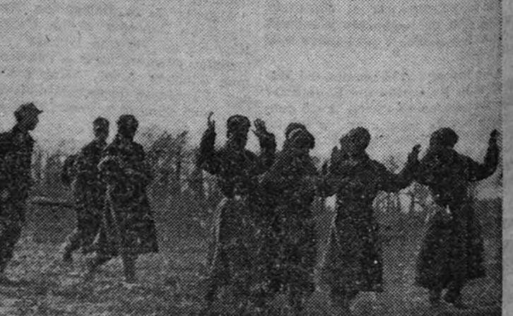
En el sector de Estanissav, y después de duros combates, fueron capturados numerosos prisioneros. Un grupo de ellos conducido hacia la retaguardia alemana