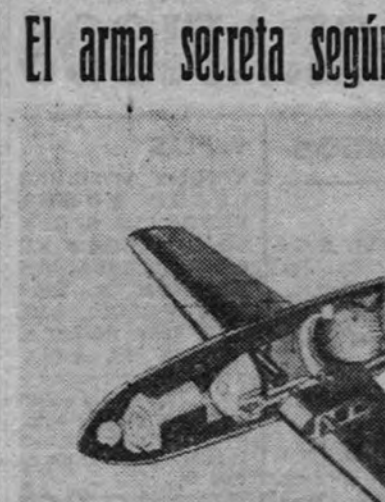
El arma secreta según los norteamericanos

Como puede apreciarse por esta sección del proyectil-cohete alemán, que al tiempo es avión sin piloto, la parte exterior del arma, que aquí se muestra según fuente yanqui, coincide plenamente con el grabado que publicamos en nuestras páginas hace unos días