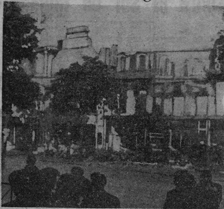
La ciudad de Caen, por cuya posesión se han librado tantas batallas desde el comienzo de la invasión, ha sido mordida por la ferocidad de la guerra. Aquí vemos unos edificios de una de sus calles principales totalmente deshechos por los bombardeos

Caen, la ciudad que también ha sufrido la guerra