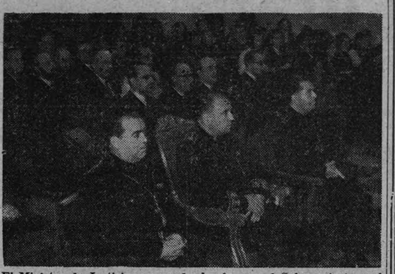
El Ministro de Justicia, camarada Aunós, con el Subsecretario y el director general de Prisiones, en la presidencia de la función religiosa.