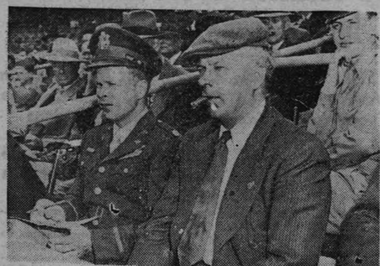
El joven comandante Bong (de uniforme), as de la Aviación yanqui, que ha conseguido derribar hasta la fecha 27 aviones japoneses, presencia en compañía de su padre (con puro y gorra) un partido de ebase-balls en Chicago, donde se encuentra descansando