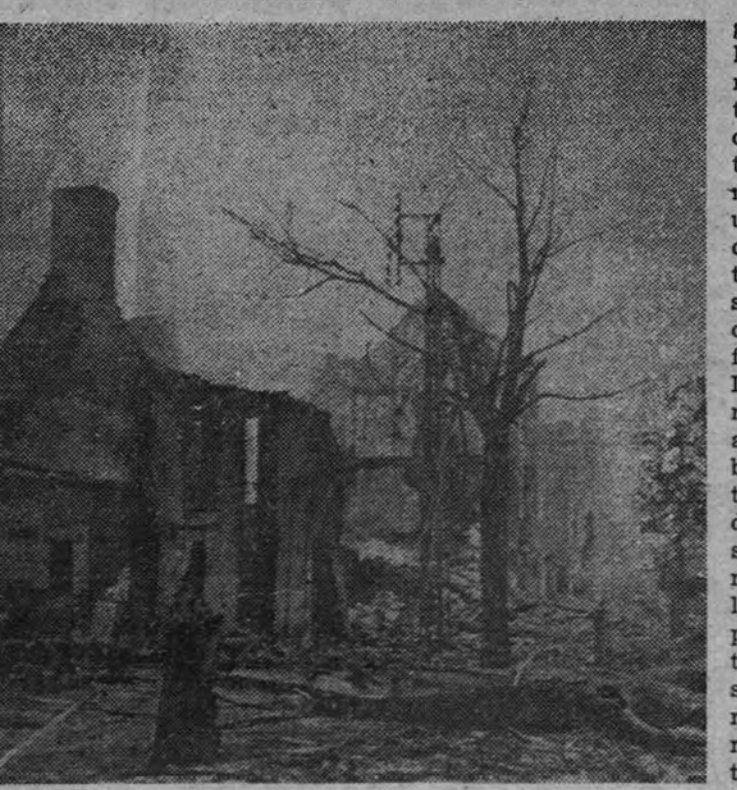
La bella ciudad de Caen, destruida por la dureza de la guerra

Veinticuatro días hace que dió comienzo el asalto de los Ejércitos anglosajones a Europa. Tiempo más que sobrado para que el nombre de la ciudad de Caen suene en todos los oídos con ecos de pesadilla. Desde el primer momento empezó a circular por el mundo: «Paracaidistas británicos han ocupado posiciones cerca de Caen...» «Fuerzas de desembarco procedentes de la desembocadura del Orne avanzan sobre Caen...» «Una vez ocupada la ciudad de Bayeux se abre ante los aliados el camino hacia Caen...» «Al Este del Orne, las tropas de Montgomery tratan de envolver la ciudad de Caen...» «Se desarrolla al Suroeste de Caen una ofensiva que busca la ruptura de las líneas alemanas...» «Los alemanes contraatacan al Noroeste de Caen...» Así, durante veinticuatro días, a unos cuantos kilómetros de la costa, bajo el fuego de la artillería naval británica y norteamericana, cerca de las playas de Normandía (puesto que, dando un paseo, se iba desde Caen a bañarse en Riva-Bella), de verano, no nos dejan dormir. De hecho, estamos ante los mismos paisajes iniciales de la invasión, delante de los mismos pueblos, en iguales orillas de iguales ríos. Aludi en mi comentario de ayer a las «ofensivas de objetivo limitado» que tanta sangre costaron, y de tan poco sirvieron, durante la