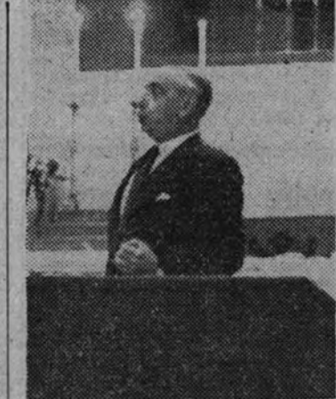
Don José María Pemán durante su intervención

man el de don Esteban Bilbao, quien al ocupar la tribuna comenzó por señalar la significación de la empresa de esta «Limosna del Papa» como ejemplo de cristiana solidaridad, limosna por amor de Dios, alarde de caridad universal, homenaje al Santo Padre y afirmación de nuestras virtudes raciales; no metal que suena únicamente, sino amor que se compadece ante la visión apocalíptica del mundo, como la caridad de un Pontífice que ha remediado el dolor lo mismo de franceses que de polacos, de belgas o de habitantes de Besarabia, de todos. Llama a Pio XII Papa de la Caridad, «Pastor Angelicus», al que se eleva esta Limosna, que al llegar a manos de los menesterosos estará ungida por el beso pontificio. Después de considerar que este homenaje al Santo Padre está caracterizado por la sinceridad y la cordialidad sin distinción ni condiciones, pasa a ensalzar la gloria del Pontificado. Habla de la gratitud de España al Papa, quien calificó la Cruzada del invicto Caudillo causa de la fe y consideró nuestras carabelas descubridoras del Nuevo Mundo como naves portadoras del divino tesoro de la fe, en palabras de intenso amor a España. Comenta el sublime tema del pontificado de Pio XII, «La paz, obra de la justicia», y considera su sagrada personalidad como llamada al destino de padecer y triunfar. Exalta las glorias católicas de la Patria misionera, la de Lepanto, etc., y termina con un momento de silencio ante la guerra es hacer la paz, el alma del alma de la fraternidad humana.