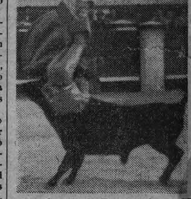
Cogida de Dominguin