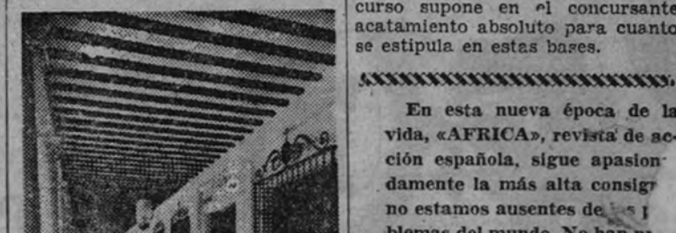
Entrada principal y soportales del nuevo y admirable edificio del Gobierno Civil de Toledo, construido por la Dirección General de Regiones Devastadas.

Ha fallecido repentinamente el general alemán Dollmann FUE EL QUE ROMPIO LA LINEA MAGINOT Orden del día del Führer BERLIN 30.—El general Dollmann, comandante jefe de un Ejército, ha fallecido repentinamente.