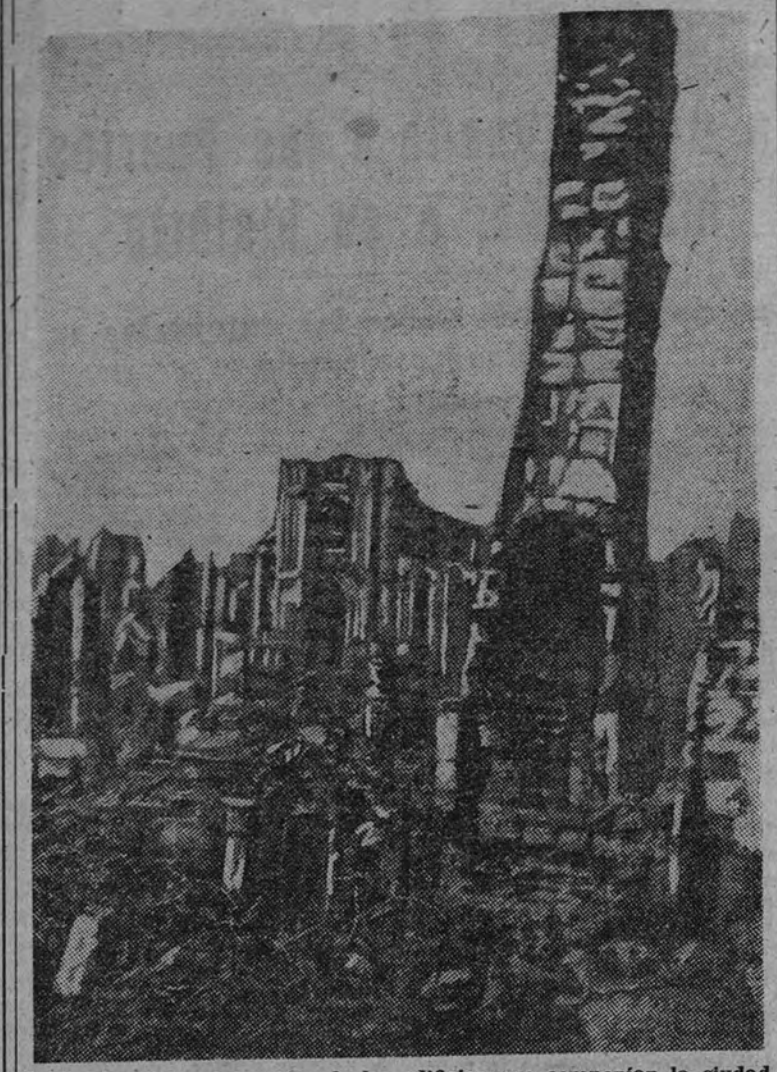
La foto muestra los restos de los edificios que componían la ciudad de Lisieux, después de las feroces luchas que se están librando en Normandía.