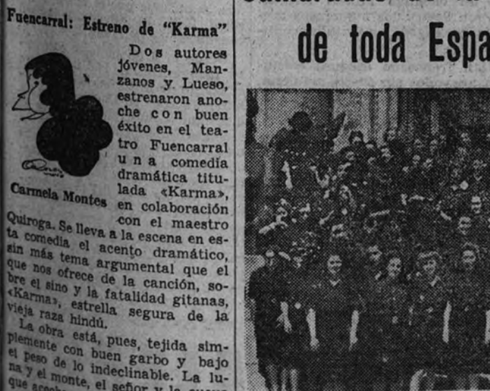
El primer grupo de camaradas de la Sección Femenina que ha llegado a Madrid para asistir a la gran concentración de El Escorial, visita el Museo del Prado