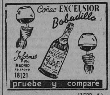
pruebe y compare (1722 A)

España tiene ya experiencia en este terreno y debe buscar la solución ideal en un proyecto estatal que comprenda los trayectos de ejecución, el sistema de financiación. Los órganos oficiales darían a la obra conjunta el más sano criterio técnico de unificación y de regularidad constructiva.