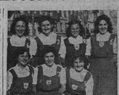
El equipo del Centro de la Sección Femenina, reciente campeón absoluto de España y finalista hoy en El Escorial

Su rival de hoy, el Buenavista, no le va en zaga en cuanto a clase y entusiasmo, pues en el Campeonato de Castilla—ganado por