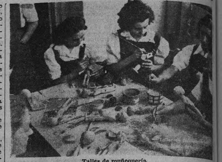
Taller de muñequería

—¿Tienen una duración de nueve meses, asistiendo, por lo regular, unas treinta cursillistas. Durante este tiempo, además del beneficio que para el futuro de cada chica representa esta enseñanza, se les entrega a cada una cinco pesetas diarias para que puedan atender sus gastos de desahuciamiento, etcétera. A finales del curso se les entrega un diploma con la calificación obtenida, que puede consis-