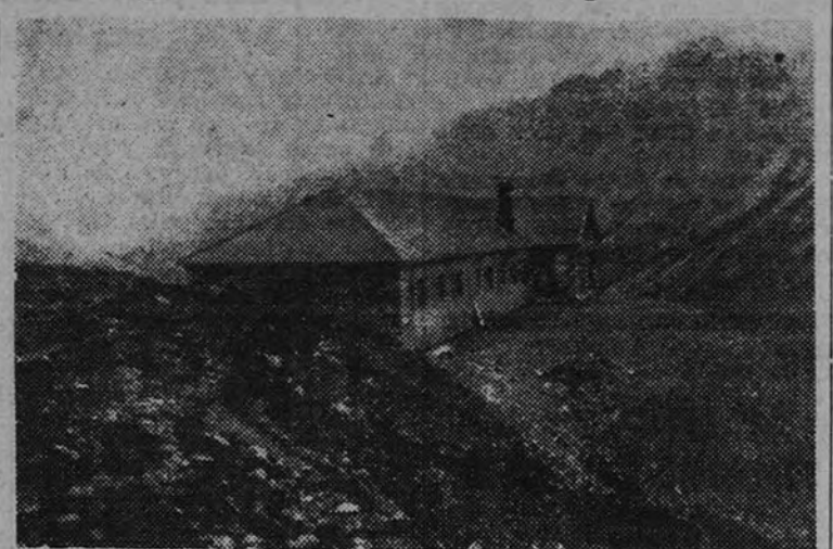
El refugio de Aliva, en los Picos de Europa, en el cual han sido introducidas importantes mejoras

El refugio de Aliva, escelta para las más bellas excursiones a través de los Picos de Europa—la «Torre del Llamado», con sus 2.639 metros; la «Padierna», a 2.400; «Peña Vieja», a 2.615; «Valdecabre», «Cumbre Arenas»,—, va a dejar de ser, por primera vez después de la guerra, un lugar inaccesible. La Dirección General de Turismo ha montado para este verano unas económicas expediciones en autocar a los lugares más favorecidos por el excursionismo en la Montaña, y entre ellas figura el viaje a los Picos de Europa, con dos o tres días de estancia en el refugio de Aliva y los servicios de caballos y guías para llegar a él.