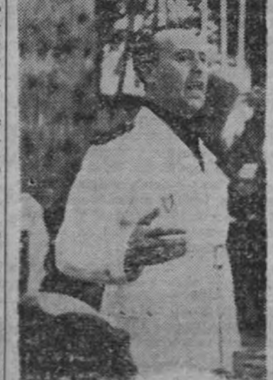
El Delegado Nacional de Sindicatos durante su discurso ante la imponente concentración de productores en la alameda de Calvo Sotelo, con motivo de la constitución de las Hermandades de Labradores y Ganaderos.

UBEDA 23.—En el día de hoy se ha constituido oficialmente en esta ciudad la Hermandad Sindical de Labradores y Ganaderos.