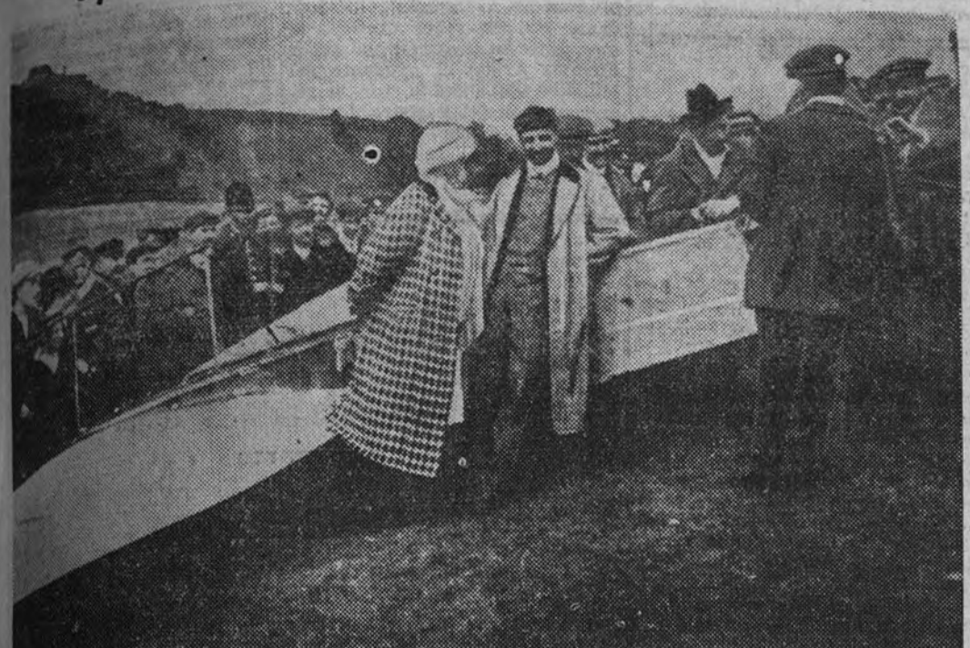
Bleriot es recibido por su esposa al aterrizar en Douvres, después de realizar por primera vez la travesía en aeroplano del canal de la Mancha

Parécete mentira, sobre todo a los jóvenes lectores, acostumbrados a considerar a la aviación como un hecho real y corriente. Pero en la vida y en la historia, que no han pasado sino treinta y cinco años desde que Luis Bleriot, uno de los primeros pilotos franceses y, por lo tanto, del mundo—pues sabido es que la aviación de la llegada a Francia de Wilbur y Orville Wright, fué en este país donde comenzó a desarrollarse la aviación—, se lanzó a realizar la estupenda hazaña de atravesar con su frágil aeroplano el canal de la Mancha.