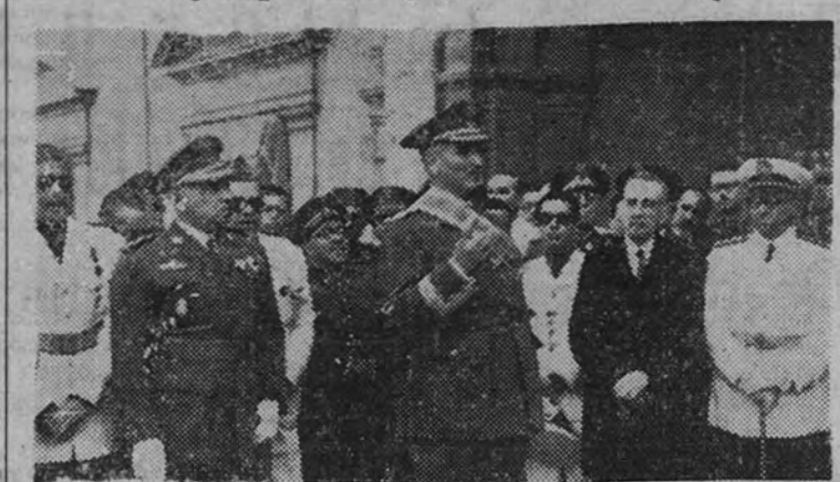
El teniente general Queipo de Llano pronuncia su discurso

La Falange andaluza ofreció al general Queipo una placa de plata