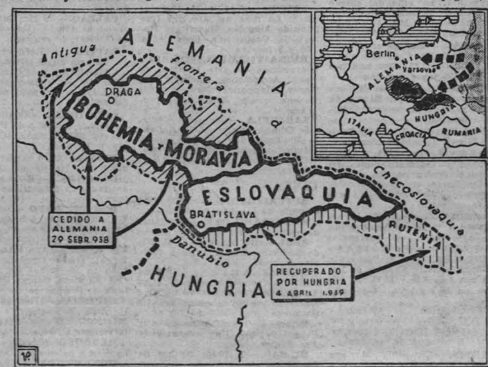
Avuntamiento de Madrid