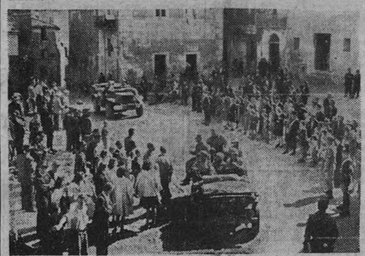
Una columna de tropas norteamericanas a su paso por la ciudad de Tolfa, en dirección a la próxima línea de combate