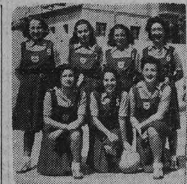
El equipo de baloncesto del Centro, de la Sección Femenina, campeón por segunda vez, será objeto de un homenaje en el campo del América

Hay se celebra un festival balonístico en homenaje a las jugadoras de la Sección Femenina, como amigables entre las chicas, y que han defendido los colores de la Sección Femenina de Madrid en el distrito de Centro.