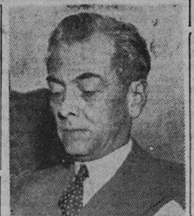
El Presidente de Filipinas, Manuel Quezón

AYUNTAMIENTO DE MADRID SECRETARIA SECCION DE CULTURA El día dieciséis del presente mes de agosto, a la una de la tarde, tendrá lugar el plazo de presentación de proposiciones para el arrendamiento del edificio del teatro Español, por término de un año, prorrogable por dos más, consecutivos.