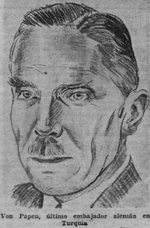
Von Papen, último embajador alemán en Turquía

Extremadura (Información en segunda página.)