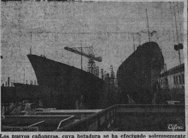
Los nuevos cañoneros, cuya botadura se ha efectuado solemnemente en El Ferrol del Caudillo

EL FERROL DEL CAUDILLO 3. (Por teléfono. De nuestro enviado especial.)—Después de presenciar la llegada del Caudillo a este Ferrol tan suyo, y antes de asistir al emocionante espectáculo de la botadura, he aprovechado el tiempo, además de para sumergirme entre la enardecida multitud popular que seguía a Franco por todas partes rodeándole y vitoreándole ruidosamente, para pisar mejor, una a una, las cubiertas de los nuevos cañoneros que hoy han quedado incorporados a la heroica gloria de nuestra Marina, tan imarcescible en Lepanto como en Cavite, en la fortuna como en la adversidad.