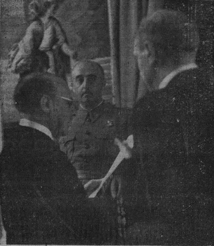
Momento de prestar juramento del cargo de Ministro de Asuntos Exteriores don Francisco Gómez Jordana en presencia del Caudillo

El general Jordana, durante los actos organizados con motivo de la fiesta del Día de la Raza por el Consejo de la Hispanidad, leyendo su discurso ante las jerarquías y las representaciones culturales y diplomáticas de los países americanos