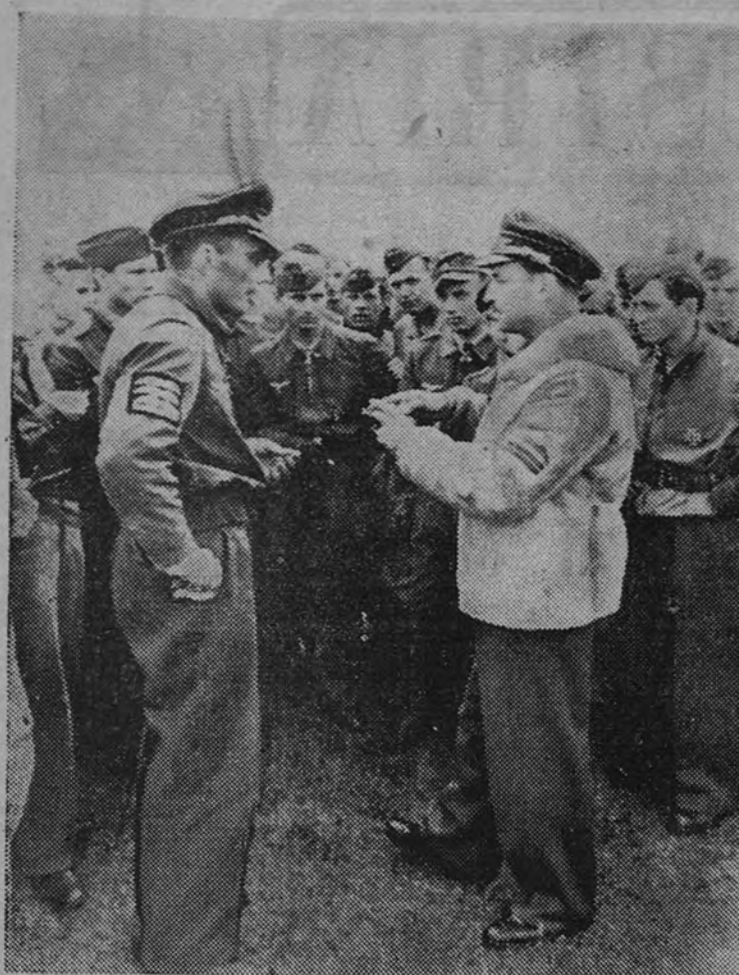
El comandante de escuadrilla mayor Dahl y el capitán Monitz, que fueron nombrados en el parte de guerra del día 8 de julio pasado, son dos ases de la defensa germana, que en una acción, y durante un espacio de tiempo de dos minutos, derribaron 30 aparatos enemigos