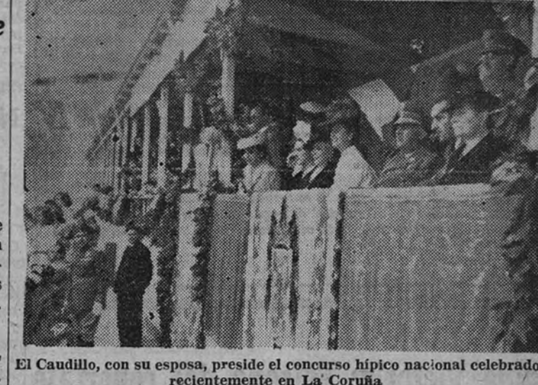
El Caudillo, con su esposa, preside el concurso hípico nacional celebrado recientemente en La Coruña