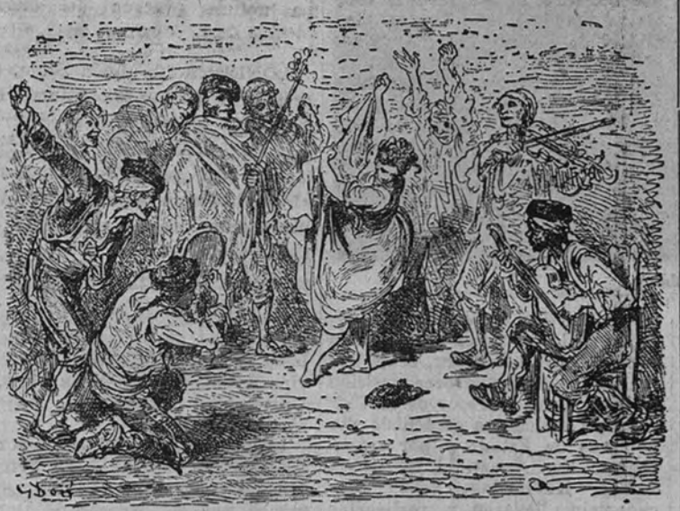
«Fiesta gitana», por Gustavo Doré

Los campesinos piden que les prohíban el consumo de licores y tabaco y que se les obligue a trabajar