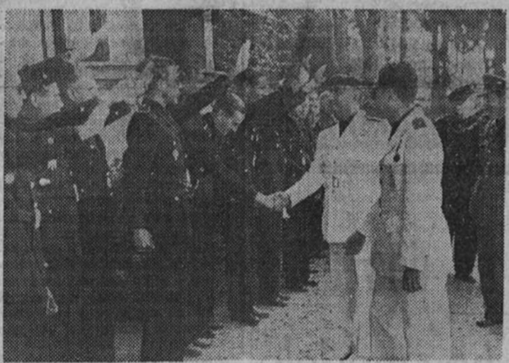
Su Excelencia el Jefe del Estado saludó y estrechó la mano de los Jefes de Sección de las distintas promociones y a los Jefes Provinciales del S. E. M.

cretarios Provinciales de Servicios, jerarcas de la Sección Femenina, Vieja Guardia, representaciones oficiales militares y civiles, etc.