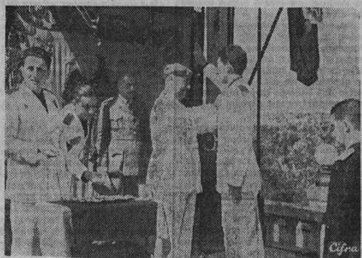
Su Excelencia el Jefe del Estado entrega las insignias a los alumnos y ex alumnos de la Escuela de Formación

Presidió la solemne entrega de insignias a alumnos y ex alumnos de la institución. En ella se celebra actualmente el curso de Mandos del Servicio Español del Magisterio. S. E. el Jefe del Estado expresó un vivísimo interés por los problemas del Magisterio español