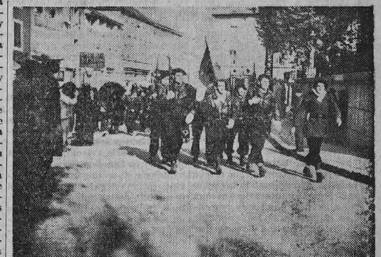
Fuerzas del «maquis» entrando en una ciudad de la Francia meridional

Resulta paradójico que en la batalla de Francia no intervinieran fuerzas regulares francesas, y el general De Gaulle anunció oficialmente la participación efectiva de un Ejército, teniendo en cuenta que, aparte los ingleses y norteamericanos, luchan canadienses y hasta una división blindada polaca en las filas aliadas. La promesa del presidente del Comité de Argel se ha cumplido, y acaba de desembarcar en Normandía una división blindada francesa, al mando del general Leclerc. Es éste un episodio de brillante historia, aunque el nombre con que se revela hoy no sea el verdadero, pues se asegura que tomó el de Leclerc para que no se ejercieran represalias con su familia, residente en Francia. Pero llámese o no Leclerc, es secundario, es lo cierto que tiene en su activo una bella página militar, la famosa marcha, con contingentes indígenas, del lago Tchéad a Túnez, llegando a tiempo para tomar parte en la batalla. Este hecho de armas causó la admiración de los aliados, y no es extraño que en Londres se le confíe el mando de la división que ahora se desembarca. Ha sido independiente del gran desembarco en el Sur.