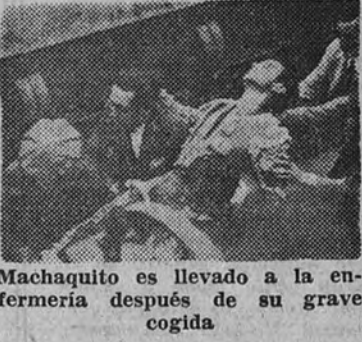
Machaquito es llevado a la enfermería después de su grave cogida

En la tarde de ayer, el torero Machaquito, con un público de 12.000 personas, se presentó en el Coliseo de Madrid. El torero, que llevaba un año de ausencia, fue recibido con gran entusiasmo. Su actuación fue brillante, logrando un triunfo completo. En la corrida, Machaquito se enfrentó a tres toros de gran calidad. Su lidio fue ejemplar, mostrando su maestría y valentía. El público, que se agotó pronto, le ovacionó largamente. Machaquito, que llevaba un año de ausencia, fue recibido con gran entusiasmo. Su actuación fue brillante, logrando un triunfo completo.