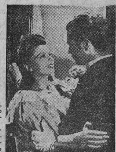
Un detalle de la película "El cuarto mandamiento", que próximamente será presentada por Chamartín.

Orson Welles EL MAGO DE UNA NUEVA TECNICA (2105 P)