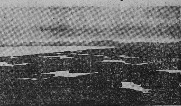
Hasta la línea danubiana de la Dobruja han llegado las vanguardias soviéticas. Junto a las ruinas de Heraclea, el Danubio—que no es azul, aunque lo digan vials—se extiende sombríamente entre una llanura pantanosa y siniestra

Bulgaria se rendirá a los aliados dentro de unos días, asegura la misma Agencia Los alemanes se retiran combatiendo hacia el Pruth y el Sereth