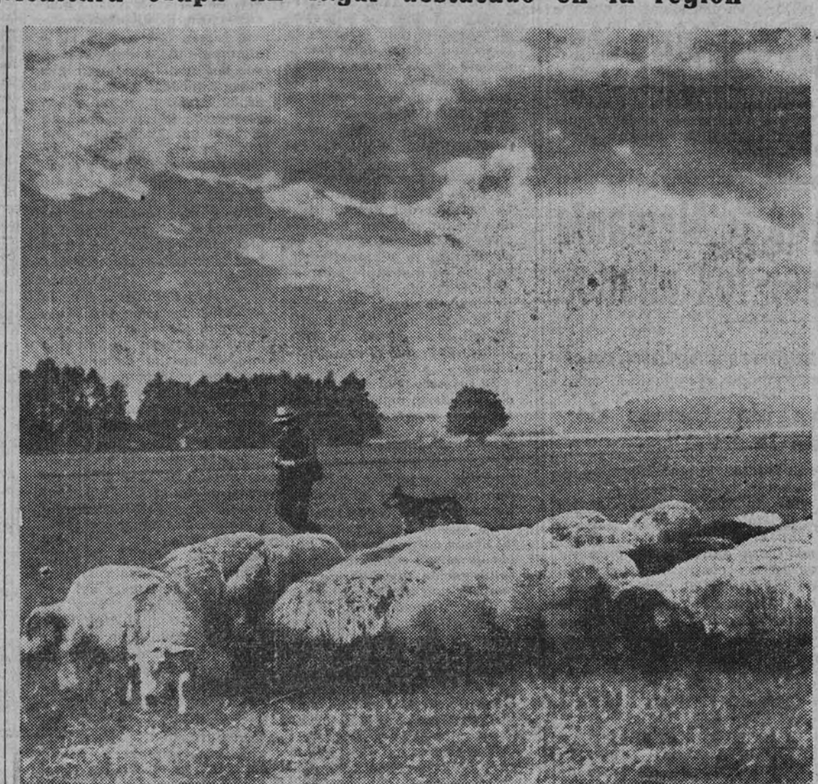
Rebano de ganado lanar

La primera feria se celebró los días 4, 5 y 6 del pasado agosto, y acudieron a ella gran número de feriantes. El éxito no pudo ser mayor, y la eficacia de la iniciativa se puso de manifiesto desde el primer día. Las transacciones superaron a todos los cálculos y a todos los vaticinios. Toda la región afluyó al pueblo de Logrosan, atraída por las ventajas que le ofrecía aquella feria, cuya necesidad era generalmente sentida.