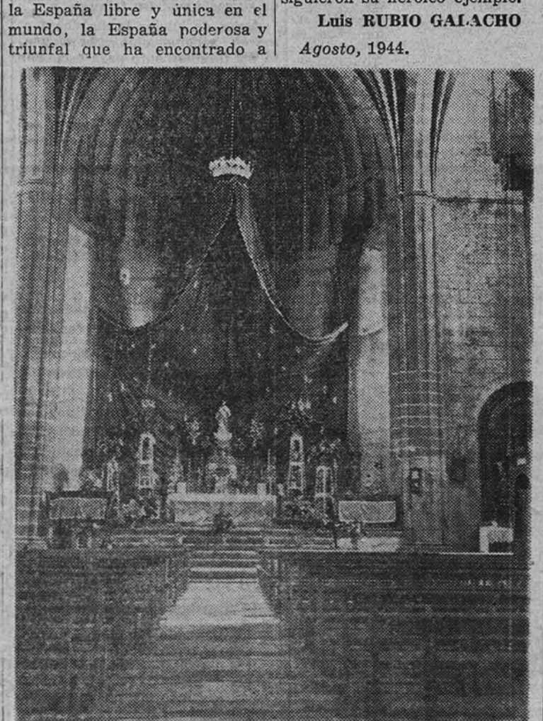
Altar mayor de la parroquia de Logrosan