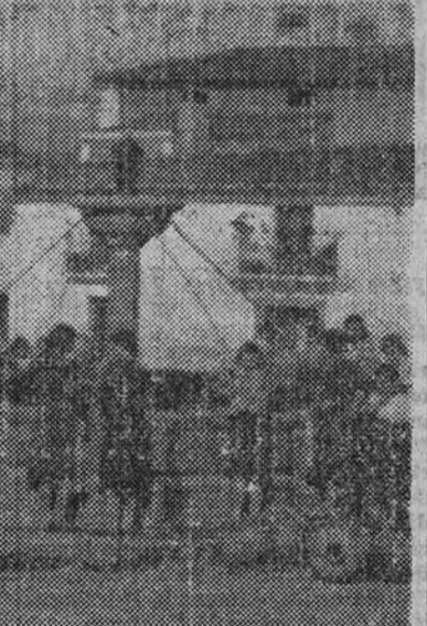
Plaza de Logrosan.—Modo típico de coger agua

El Monasterio de Guadalupe, monumento prodigioso, elevado por la piedad española al cielo de sus indestructibles creencias,