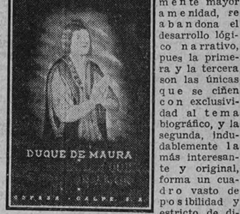
DUQUE DE MAURA

Se divide el libro en tres partes, en cuyo orden, y para darle probablemente mayor amplitud, se abandona el desarrollo lógico y narrativo, pues la primera y la tercera son las únicas que se ciñen con exclusividad al tema biográfico, y la segunda, indudablemente la más interesante y original, forma un cuadro vasto de posibilidades y estricto de dibujo con la vida social y económica de la época. Creo que ésta, por su carácter completo, en cierto modo debió constituir el final del libro para no romper el dramatismo biográfico de la narración.