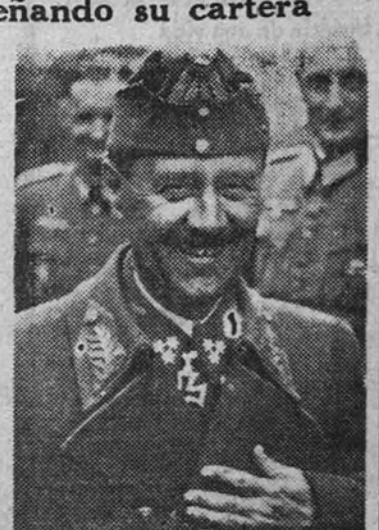
Capitán general Lakatos, nuevo presidente del Gobierno húngaro

BUDAPEST 29.—El Gobierno Sztojay ha presentado la dimisión, que ha sido aceptada por el Regente Horthy. Ha sido nombrado nuevo presidente del Consejo de Ministros el capitán general Lakatos.