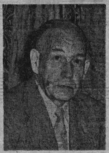
Excmo. señor don J. H. Hayes

Importantes declaraciones del embajador norteamericano en España, Mr. Hayes, a los corresponsales de la Prensa extranjera