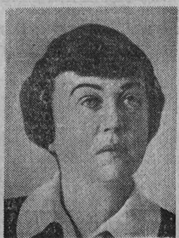
Alejandra Kollontai, embajadora de la U. R. S. S. en Suecia

Poco antes de la guerra del 14 una denuncia anónima reveló a la Policía la extraña vida de la distinguida esposa del coronel Kollontai. Alejandra tuvo que salir de su patria precipitadamente. En Gine-