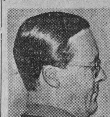
El príncipe Bernardo de Holanda, que ha sido designado jefe de las fuerzas holandesas del interior, a las órdenes inmediatas del general Eisenhower

El príncipe Bernardo ha sido nombrado jefe de las Fuerzas Holandesas del Interior