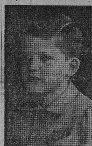
Simeon II, Rey de Bulgaria