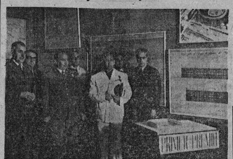
Las personalidades que inauguraron la Exposición de proyectos para el gran estadio del Real Madrid, durante su visita a la misma