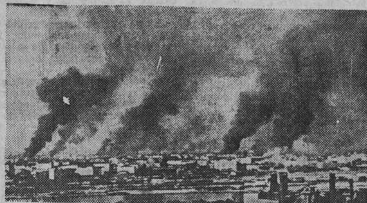
Incendios en Varsovia causados por los encendidos combates que se vienen desarrollando actualmente en el interior de la ciudad

de la capital se oía ya el fuego de cañón.