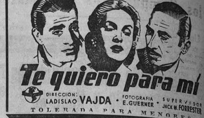
UN FILM ESPAÑOL DE PRESENTACION EXCEPCIONAL

"Te quiero para mí" es una película de presentación excepcional. Es natural que así sea, porque la Universal no podía proceder de otra manera. Al editar su primera película española, forzadamente debía vestirla igual o mejor todavía—si ello era posible—que sus