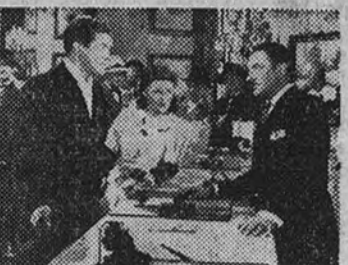
Una escena de la película "Grandioso de amor", que con grandioso éxito se proyecta en el cine Progreso