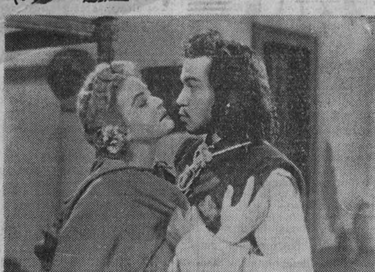
Codazos, pistoles, rodillazos... crujirán los brazos y las patas de las butacas; público, operador y acomodadores se revolverán por el sitio; habrá bajas: de muertos de risa; se tambalearán las columnas y las barandillas... Todo esto pasará en el Palacio de la Prensa con la presentación de Cantinflas en "Los tres mosqueteros", que se estrenará hoy jueves, a las 10.30 de la noche