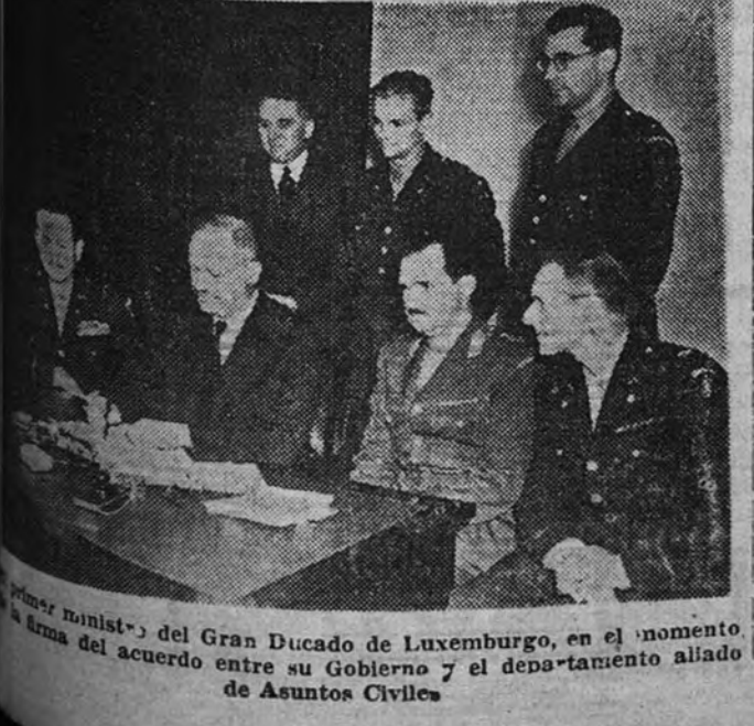
Primer ministro del Gran Ducado de Luxemburgo, en el momento de la firma del acuerdo entre su Gobierno y el departamento aliado de Asuntos Civiles

ACUERDO ENTRE LUXEMBURGO Y EL DEPARTAMENTO ALIADO DE ASUNTOS CIVILES