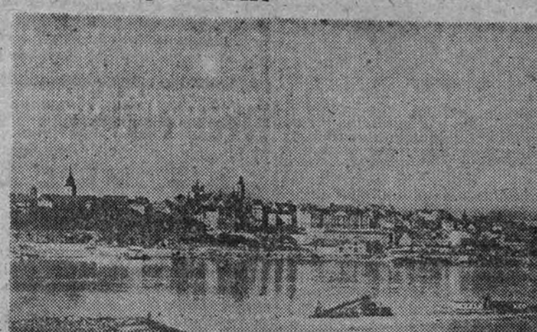
Una vista de Varsovia

De pronto, cuando casi nos habíamos olvidado del frente ruso que cruza por las cercanías de Varsovia, el Mariscal Rokossovsky se lanza al asalto. ¿Encontrará alguien, de una vez, los misterios de la acción moscovita y sus laberintos y recovecos? La página de Bulgaria es inabarcable. Por la prensa y los círculos políticos del mundo enarbolan, las unas contra las otras, cinco o seis interpretaciones distintas. ¿Todas tan poco ciertas, y todas un poco falsas? ¿Alguna de ellas dice la verdad?