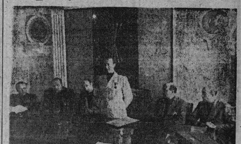
El Vicesecretario de Obras Sociales y Delegado Nacional de Sindicatos durante su discurso en el acto de la firma del concierto sobre el Seguro de Enfermedad