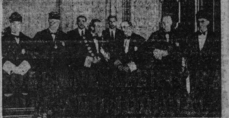
El presidente del Tribunal Supremo, con los magistrados, al terminar el acto

El presidente del Supremo, don Felipe Clemente de Diego, pronunció un importante discurso