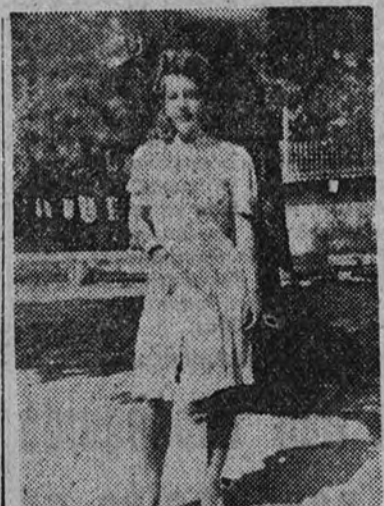
—¿Son buenos los niños?

—Bien. Digamos que todo lo que le da al vivir emoción como de novela policíaca.