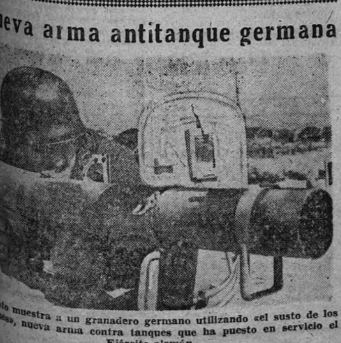
Nueva arma antitanque germana

El Gran Hotel de la plaza de la Opera ha sido requisado para convertirlo en Club dedicado exclusivamente a los soldados aliados. Para facilitarles la vida a éstos se va a disponer que todas las cartas de los restaurantes parisienses tengan una adición en inglés. La Policía francesa ha anunciado la detención en Bayona del escritor Pierre Benoit, acusado de haber colaborado con los alemanes. (Efe.)