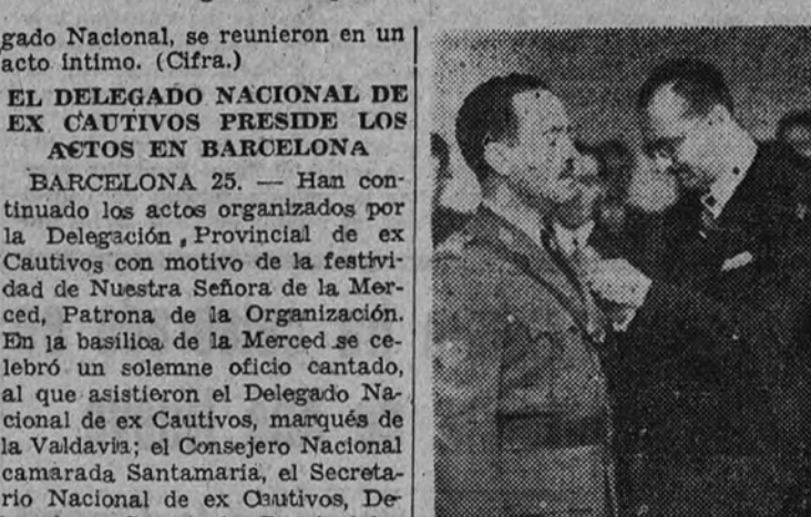
Momento de la imposición de la Medalla del Mérito Penitenciario al director de la prisión de Carabanchel (Foto Contreras.)

gado Nacional, se reunieron en un acto íntimo. (Cifra.)