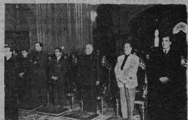
Con motivo de la fiesta de la Virgen de las Mercedes, Patrona de los ex cautivos, la Delegación Nacional celebró una solemne función religiosa.—La presidencia del acto