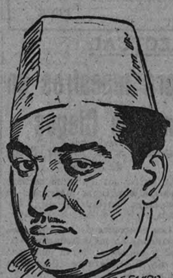
Muley el Hassan

DISCURSO DEL ALTO COMISARIO El teniente general Orgaz pronunció el siguiente discurso: «Alteza: El constante y frecuente contacto mantenido, antes que nada, con el afecto cordial de una vieja amistad, inspirado después por la labor responsable de un trabajo común y arduo, además, por la atenta vigilancia y hasta la alentadora preocupación que