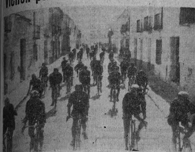
Los ciclistas del Frente de Juventudes de las provincias de Cádiz, Sevilla, Córdoba, Huelva, Málaga y Almería, en ruta hacia Madrid, atraviesan un pueblo manchego en la jornada de ayer

Escuadras de todas las provincias vienen por carretera hacia Madrid