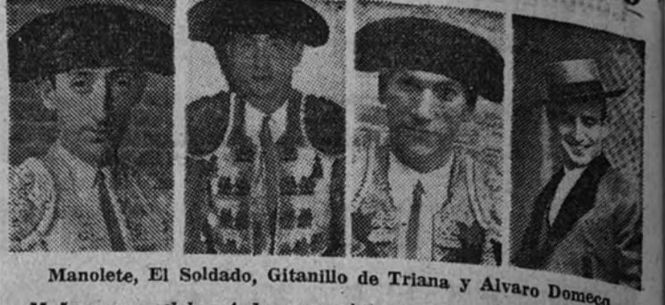
Manolete, El Soldado, Gitanillo de Triana y Alvaro Domecq