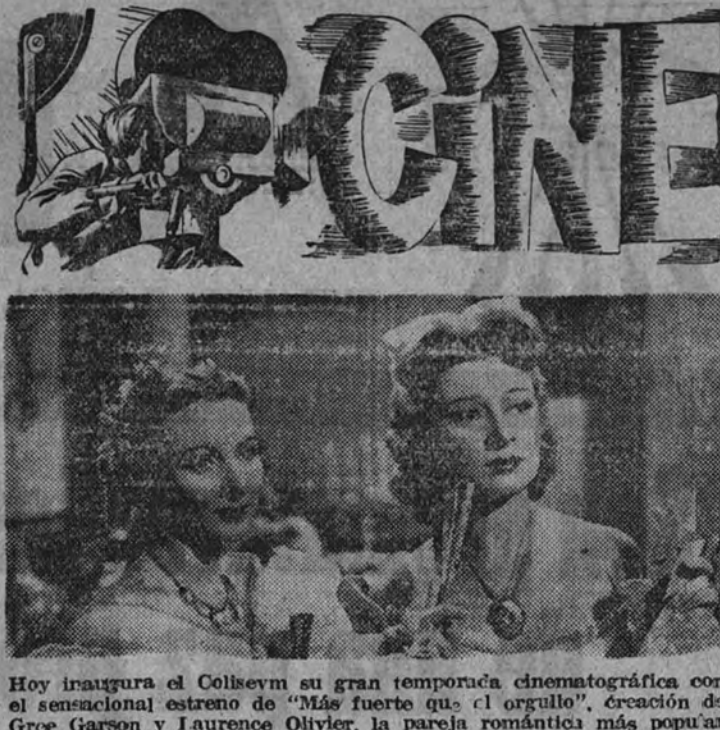
Hoy inaugura el Colisevm su gran temporada cinematográfica con el sensacional estreno de "Mas fuerte que el orgullo", creación de Greer Garson y Laurence Olivier, la pareja romántica más popular y admirada del cine americano. "Mas fuerte que el orgullo" es un magnifico anticipo de la brillante campaña cinematográfica que comienza hoy