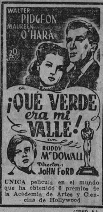
UNICA película en el mundo que ha obtenido 6 premios de la Academia de Artes y Ciencias de Hollywood

BELLAS ARTES. —(El orgullo de los yanquis (Gary Cooper).