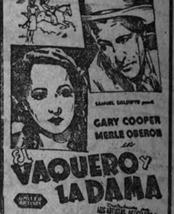
En los salones Imperial y Palacio del Cine continúa el éxito de "El vaquero y la dama". He aquí a Merle Oberon en un momento de este film