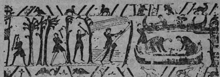
La construcción de la Flota de Invasión, según un fragmento del tapiz de Bayeux

BERLIN 6.—Al iniciarse la invasión de Normandía el 6 de junio del corriente año, las autoridades alemanas—se precisa en los centros competentes—se preocuparon de poner salvo las obras de arte de dicha región, haciéndolo en primer lugar con el famoso tapiz de Bayeux, que cuenta noventa y cinco años de existencia, y que posteriormente fué llevado a París y entregado a las autoridades del Museo del Louvre, las cuales, después de oponer una serie de dificultades, accedieron finalmente a hacerse cargo del tapiz y a encargarse de su custodia. (Efe.)