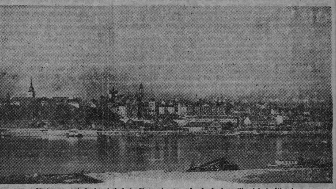
Vista general de la ciudad de Varsovia, tomada desde la orilla del río Vístula

Las baterías de Lorent continúan intensamente su actividad. Una de las más duras batallas de la guerra se desarrolla entre las fortificaciones de Fort Driant, donde a los persistentes ataques aliados siguen fuertes contraataques alemanes. Los ataques de gran estilo desencadenados por los aliados en Gellenkirchen han sido rechazados con grandes pérdidas. Intervienen en el combate fuertes formaciones aéreas de ambos bandos. Han sido reforzados los efectivos alemanes en la región de Arnhem. El frente germano del Escalda gira rápidamente hacia el Norte, teniendo como base Tilburg. Los canadienses (Continúa en cuarta página.)