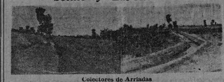
Colectores de Arriadas

Mañana se entregarán las obras de «Sotillo» y «Las Arriadas»